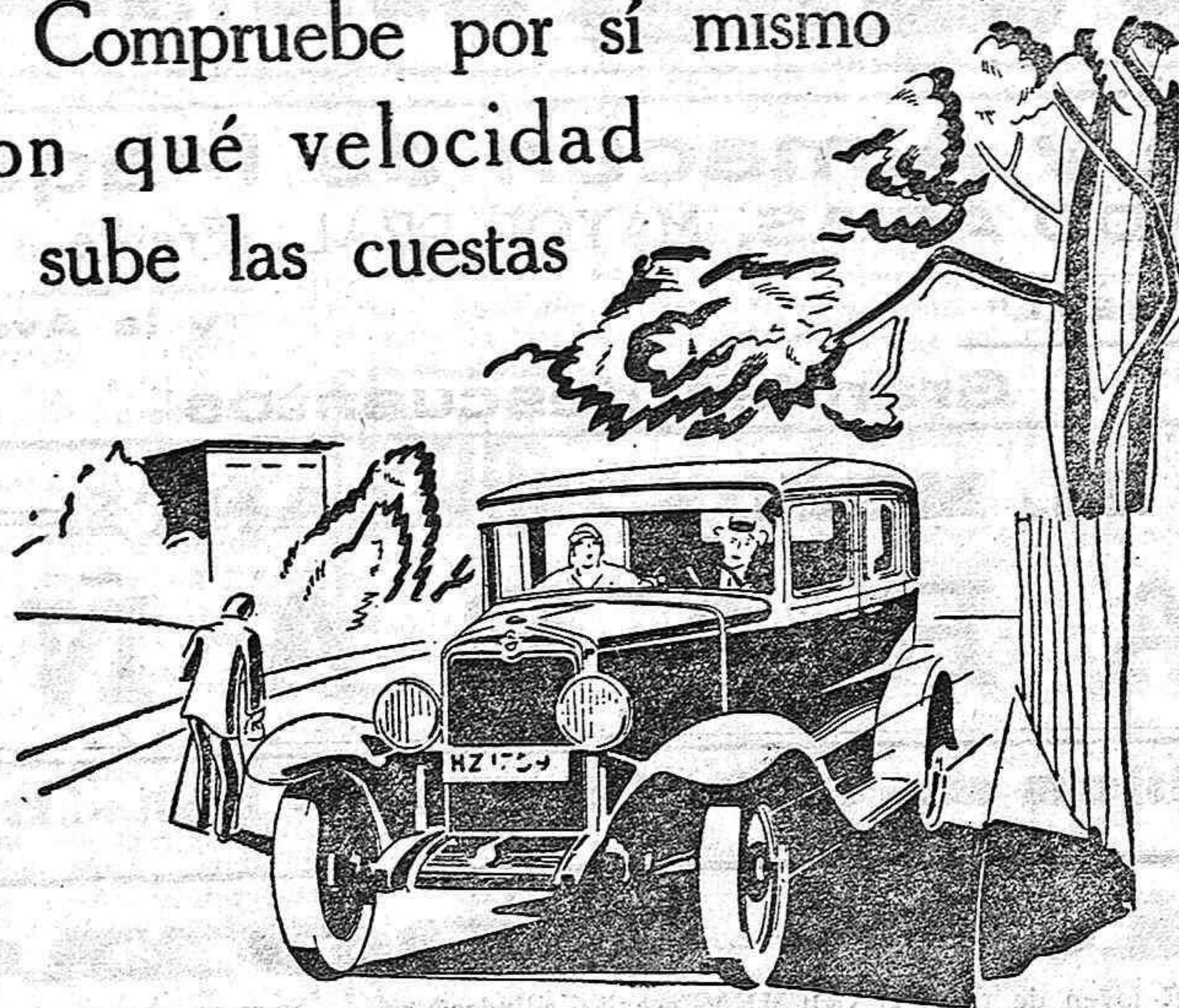
Observe la línea airosa y elegante que Fisher ha sabido dar a sus magníficas carrocerías

Compruebe por sí mismo con qué velocidad sube las cuestas