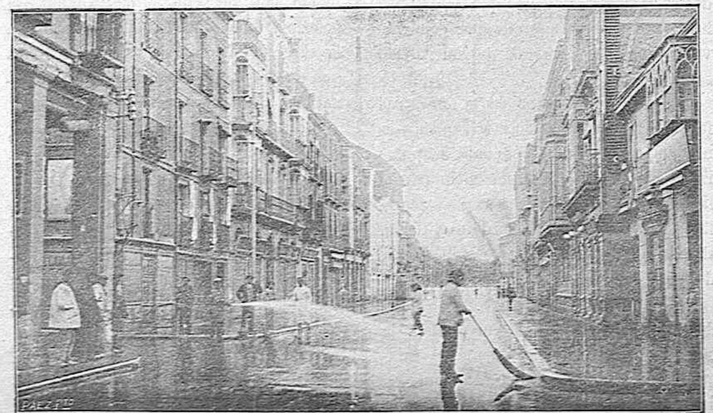
AVENIDA DE LA ESTACION POR DONDE S. M. EL REY HA HECHO SU ENTRADA EN PALENCIA