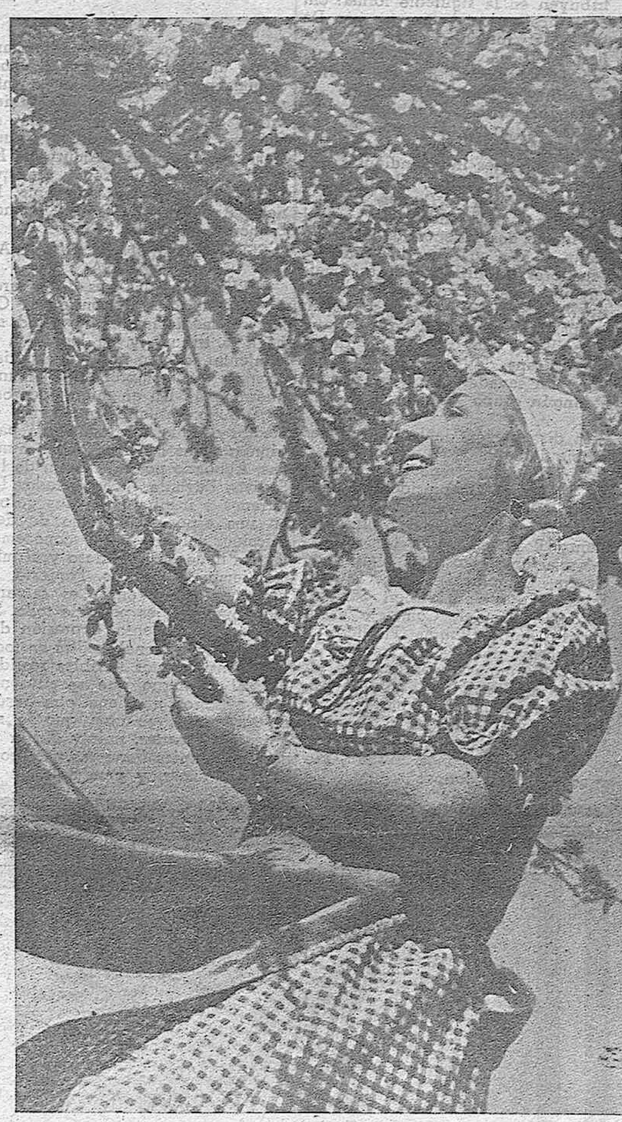
Con la solemnidad conmemorativa de la Resurrección del Señor, nace la segunda primavera de nuestra paz. Cuando España recorre, por fin, el camino de su reincorporación a su grandeza tradicional; cuando el Caudillo traza sobre el mapa nacional las directrices que son precursoras de halagüeñas realidades, surgen a la vida los tesoros de nuestros jardines, que simbolizan el renacer triunfal de los vergeles de la raza.

La estancia de S. E. el Jefe del Estado en Sevilla (Información en octava plana)