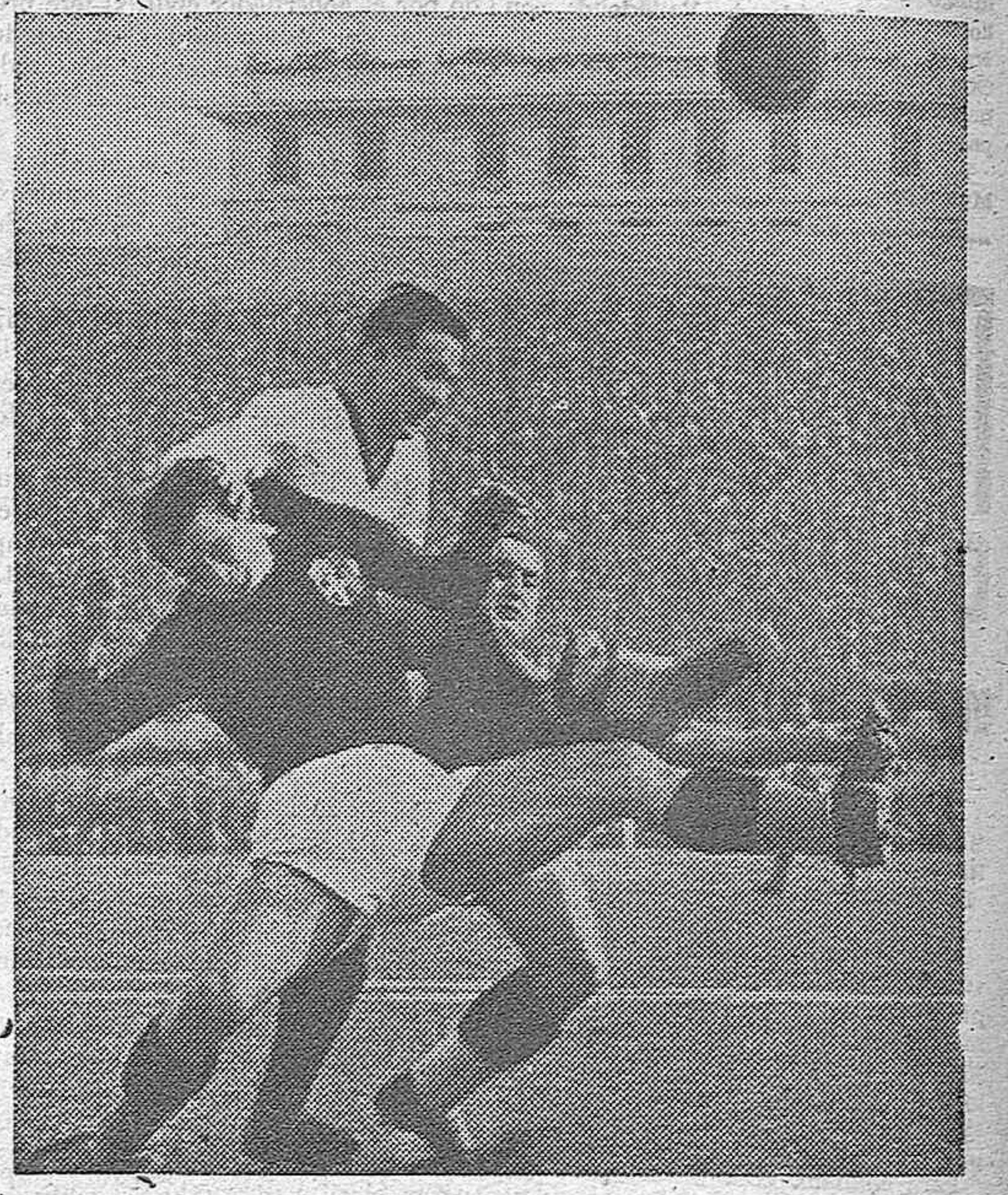
Una fase del emocionante encuentro entre el Bolonia y el Génova, que afianzó, con la victoria en campo contrario del primero, su magnífica posición en el torneo