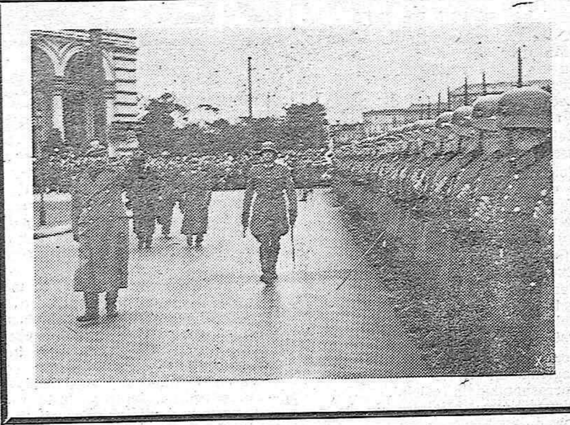
El ministro italiano Farinacci, huésped del Reich durante varios días, pasa revista al batallón que le rinde honores a su llegada a Berlín