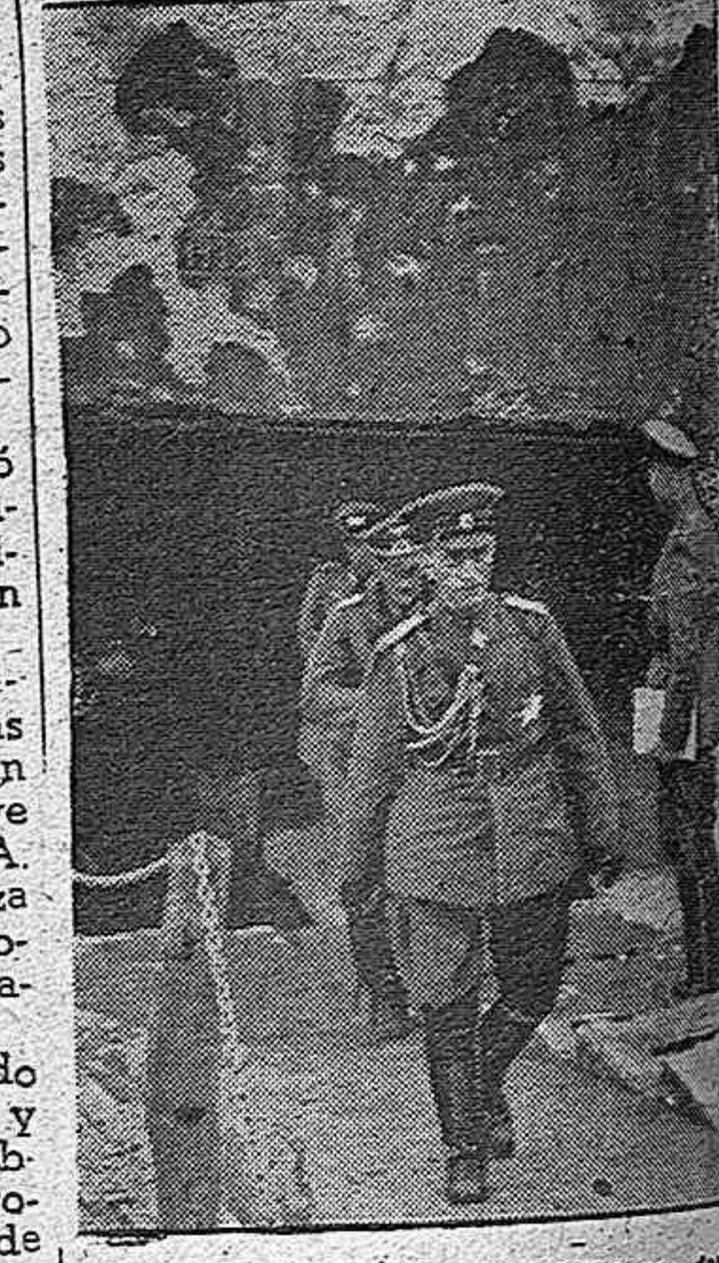
El jefe del Estado Mayor búlgaro, General Cheikoff, durante su reciente visita a París que fué línea Maginot.