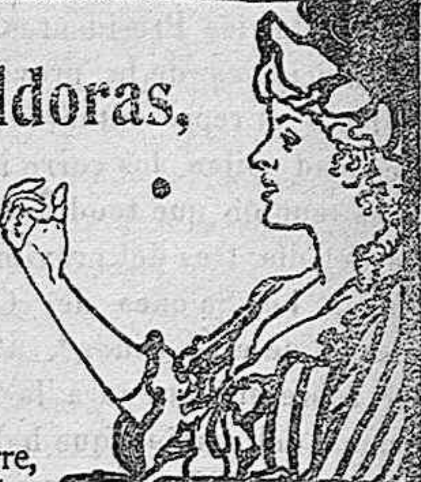
Acerque el grabado à los ojos y verá Vd. la píldora entrar en la boca.

DE VENTA EN LAS BOTICAS DEL MUNDO ENTERO. 40 Píldoras en Caja.