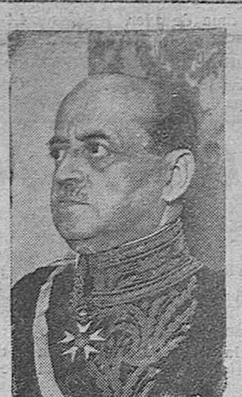
El general Benavides, ex presidente del Perú...