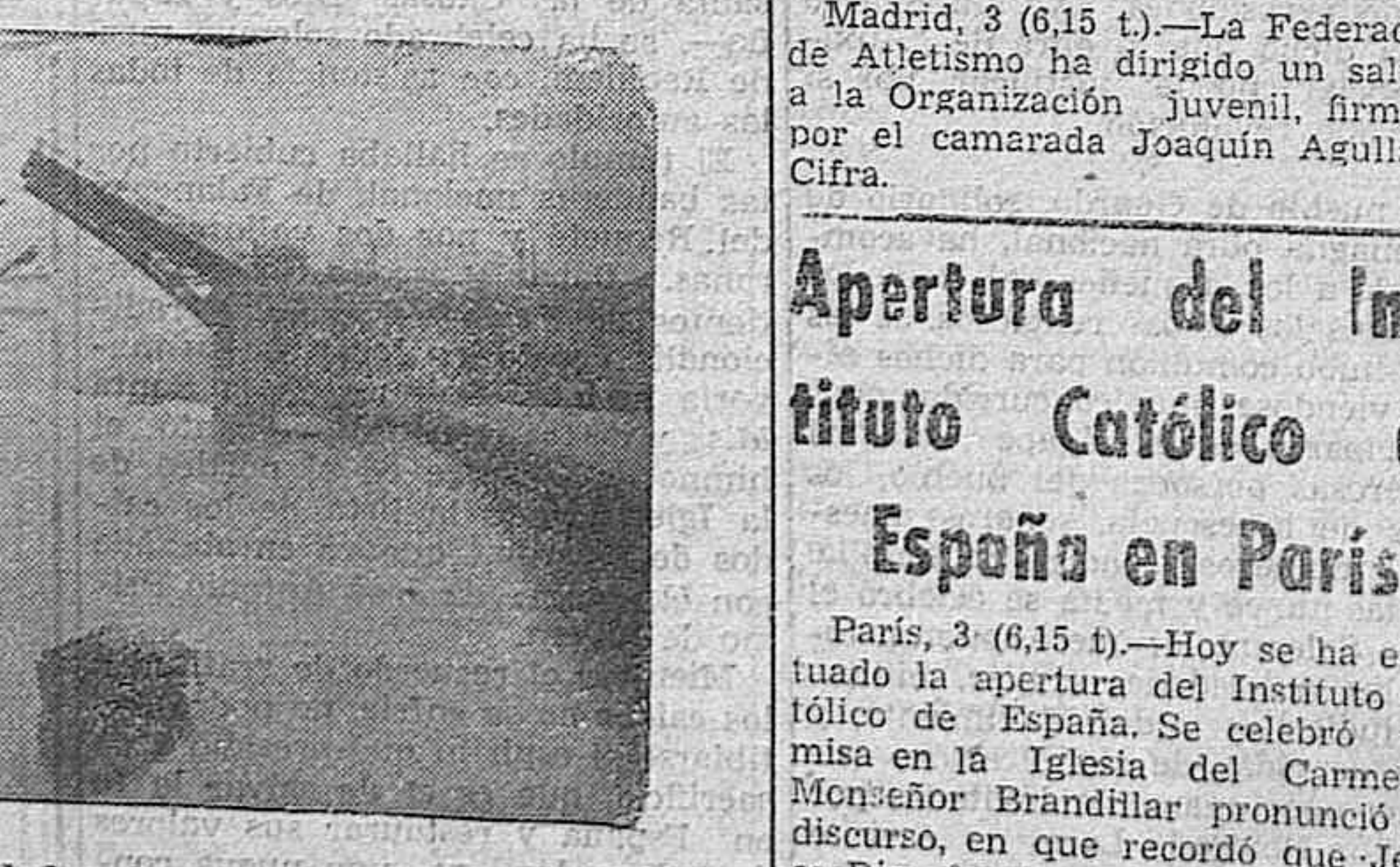
Soldados ingleses en Francia.