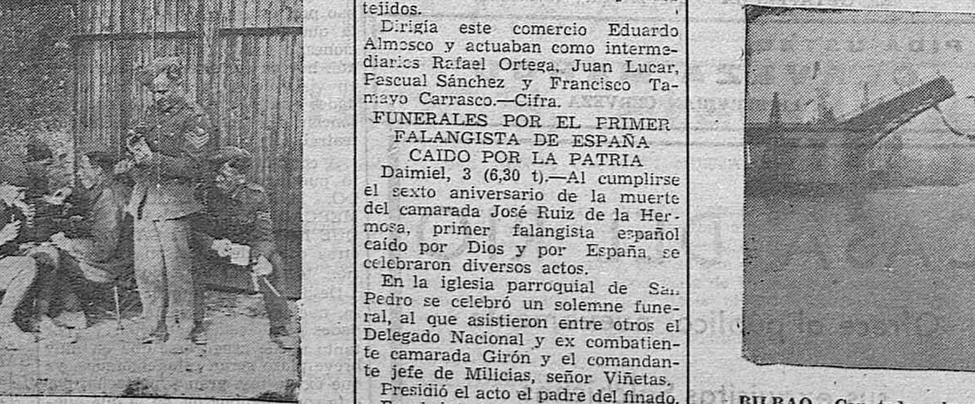
Soldados ingleses en Francia.