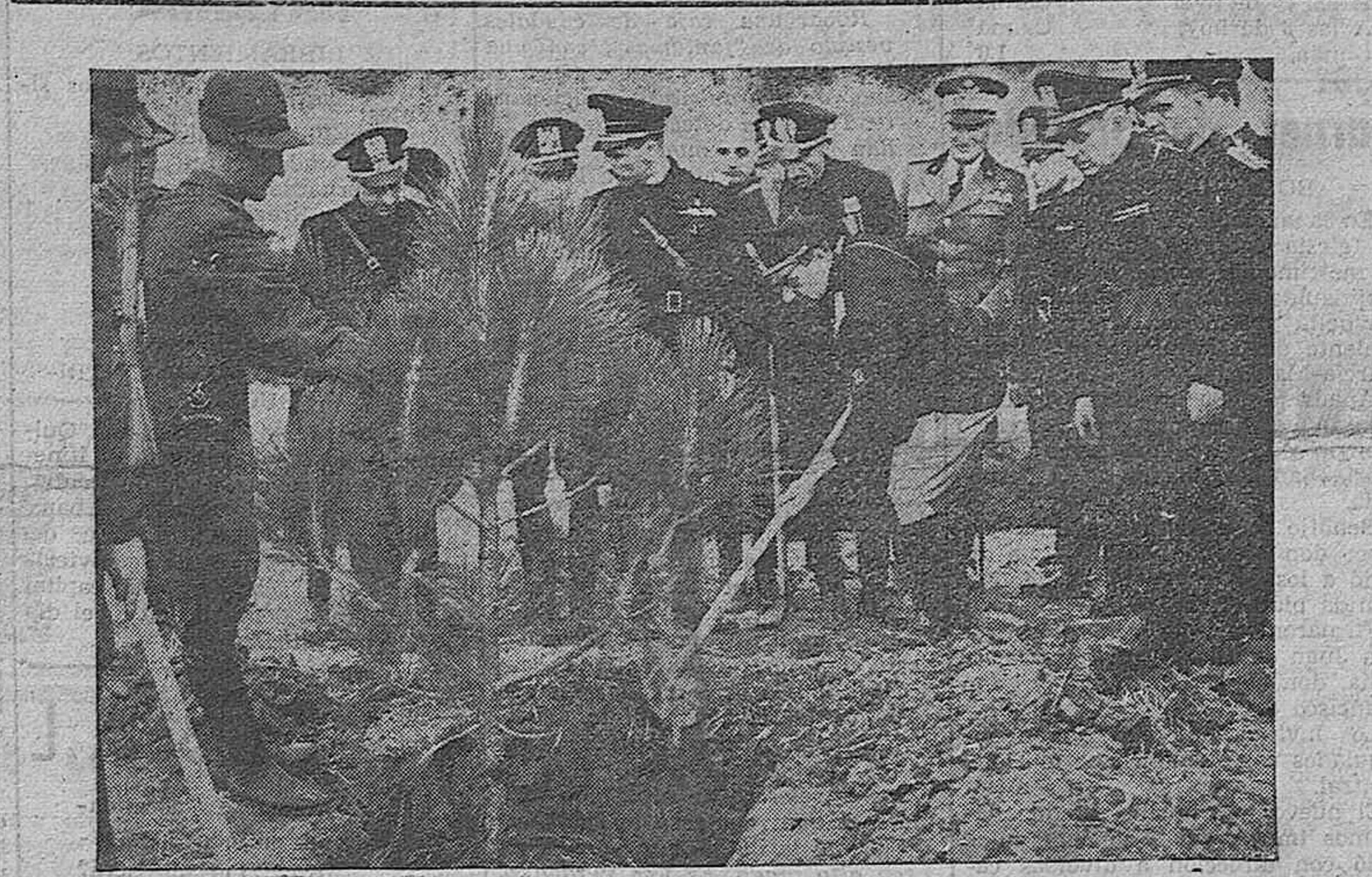
PALERMO.—Una gran obra de beneficencia. S. E. el ministro secretario del partido nacional fascista, da comienzo a los trabajos del latifundio siciliano.

Roma, 3 (4.30 t).—Esta mañana se ha verificado el cambio de poderes entre los antiguos y nuevos ministros. Estos y el nuevo secretario del Partido prestaron juramento ante el Rey-Emperador, estrechando la mano al Duce.—EFE. UNA FLOTA MERCANTE ARGENTINA Buenos Aires, 3 (4.30 t).—El Go-