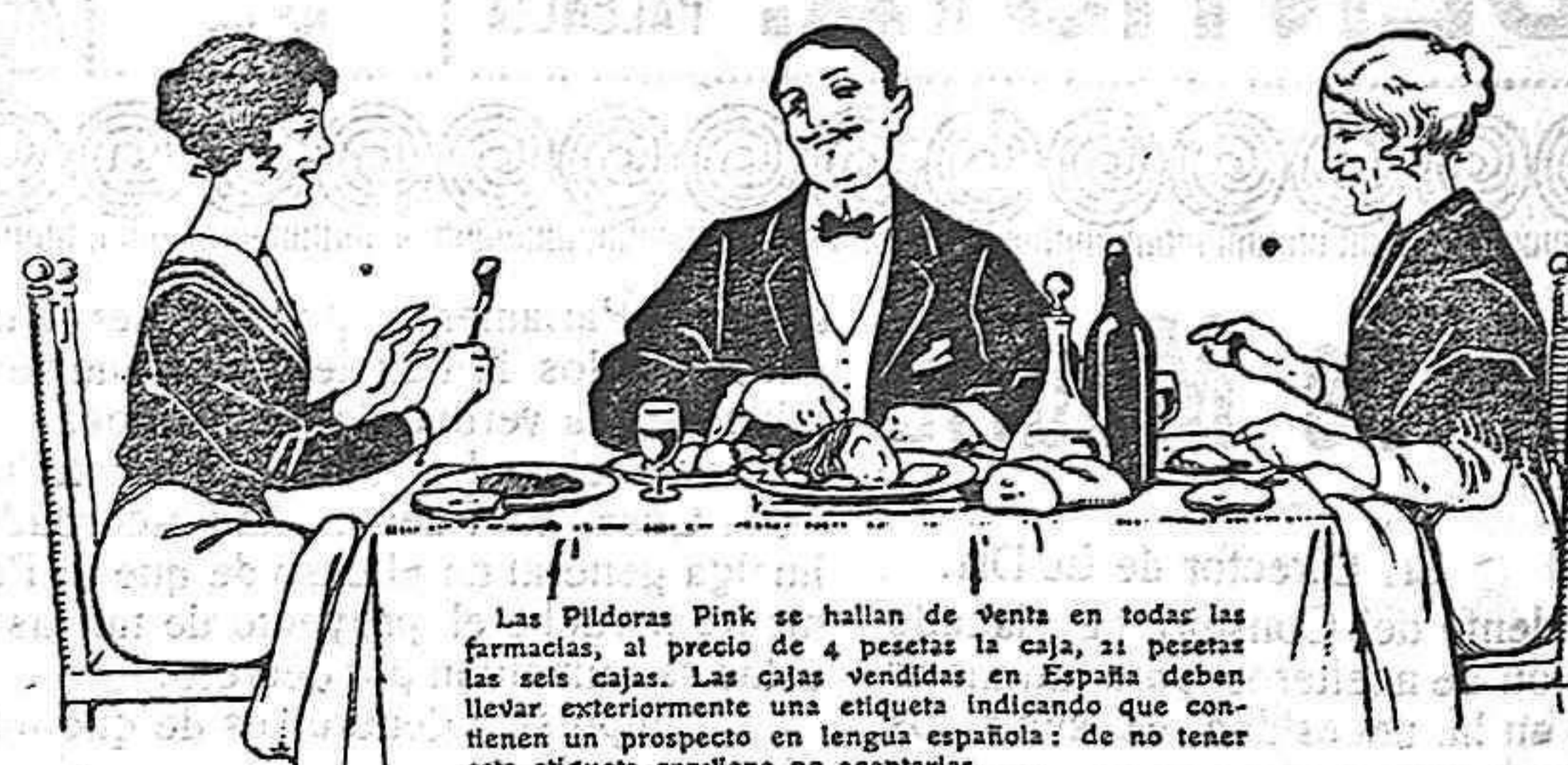
Las Pildoras Pink se hallan de venta en todas las farmacias, al precio de 4 pesetas la caja, 21 pesetas las seis cajas. Las cajas vendidas en España deben llevar exteriormente una etiqueta indicando que contienen un prospecto en lengua española; de no tener esta etiqueta conviene no aceptarlas.