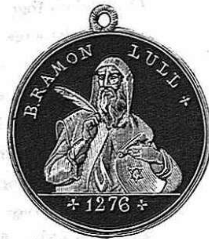
MEDALLA DEL CENTENARIO DE RAIMUNDO LULLIO. (Véase la página 109).

pongan á los lectores al tanto de lo mucho, muchísimo que sobre Cervantes y el Quijote han discurrido celebrados escritores nacionales y extranjeros.— Así, en sus lugares respectivos verán los curiosos recopilado en breves páginas, cuanto se ha dicho, escrito, pensado y desvariado sobre los originales de Don Quixote y de Dulcinea ; de Sancho y de los Duques ; del caballero del verde gaban y del primo que acompañó al Hidalgo á la cueva de Montesinos ; y al paso encontrarán la explicación de algunas aventuras, en cuanto puede hacerse, y lo que sobre otras han conjeturado y averiguado ilustres cervantistas; que sin despreciar los trabajos de ninguno, ni aún del más insignificante, llevaremos por guías y compañeros á don Antonio Puigblanch, D. Bartolomé José