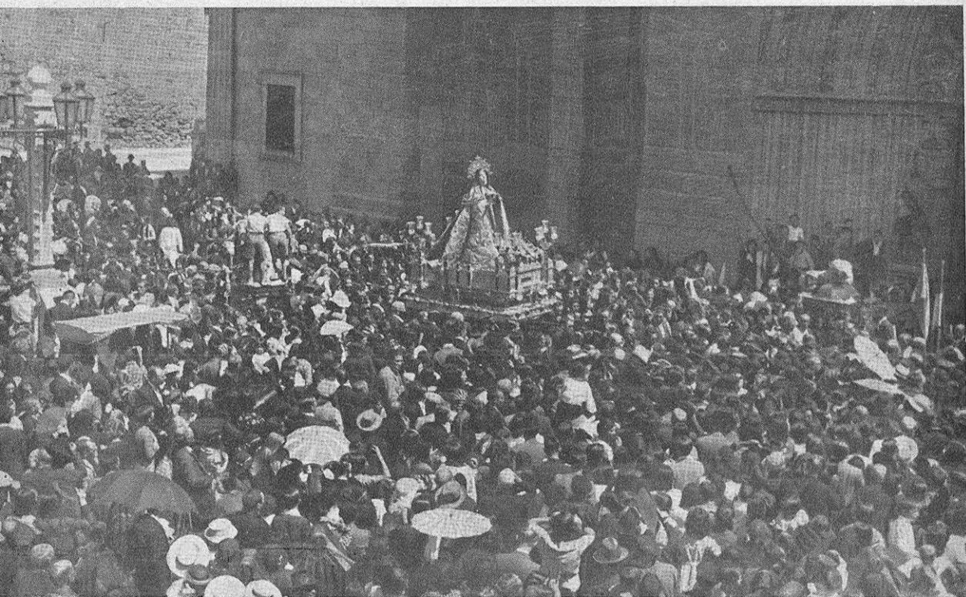
AVILA.—PROCESION DE SANTA TERESA

ÓRGANO DE LA JUNTA PROVINCIAL DEL TURISMO DE AVILA