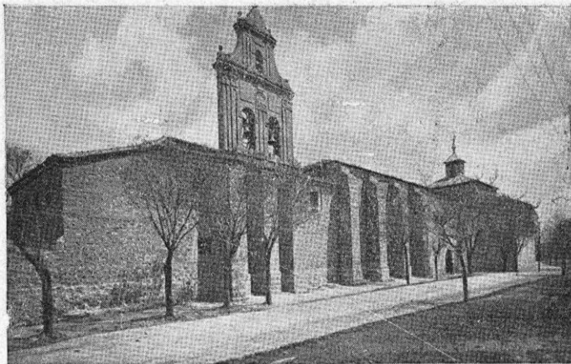
Convento de la Encarnación

Veredas, fondo como se recordará del Mercado del viernes. Este viernes semanal, el día de Ávila , el día que creó Isabel y Teresa vió con arrieros y traficantes, compañeros de su andariego vivir.