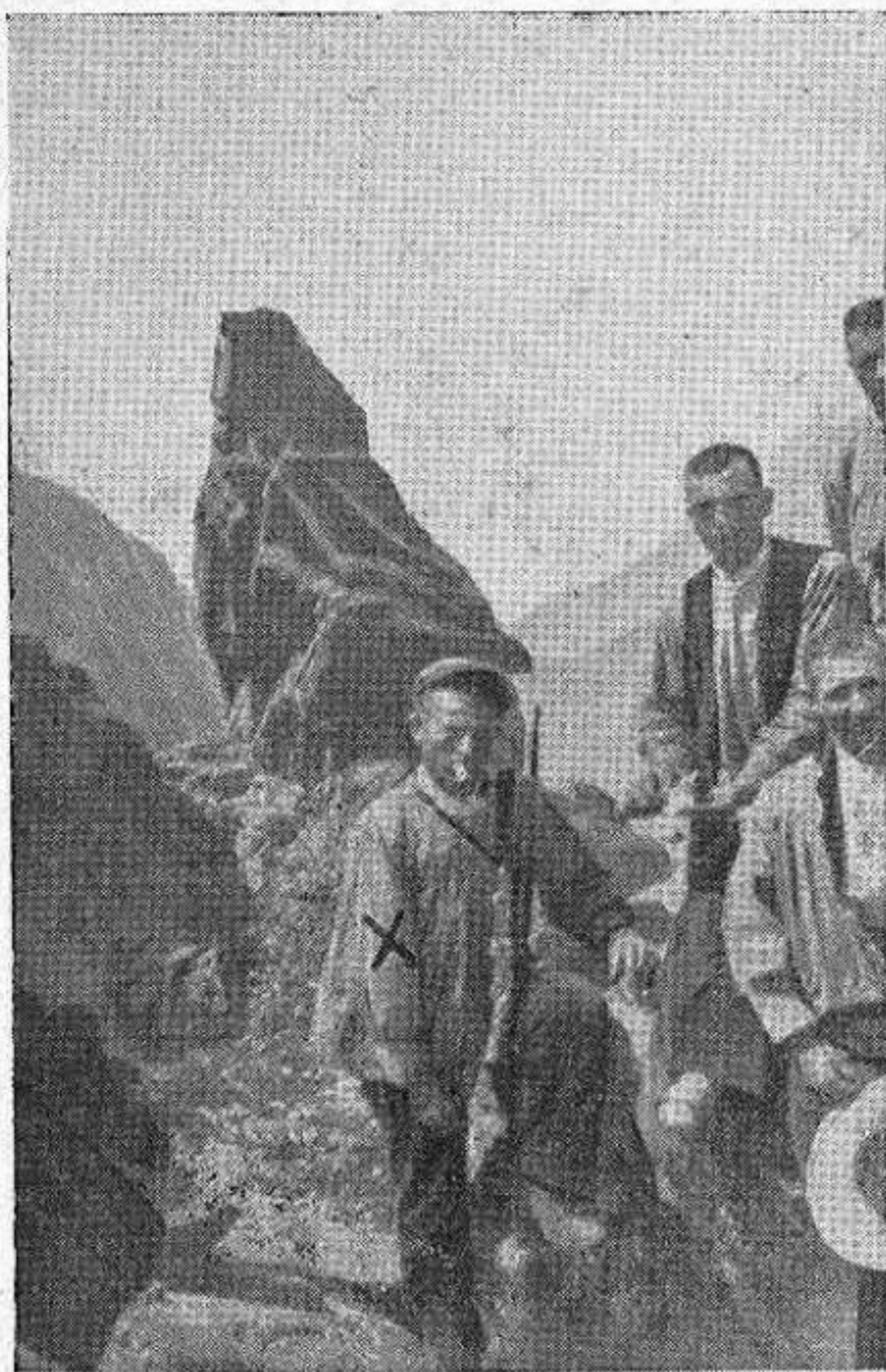
Peña de Chilla.

A la mañana siguiente salimos para ir visitando periódicamente la inmensa crestería. Aun no ha salido el sol y ya estamos de marcha. El fresco matinal nos ayuda a subir la pendiente. Es una brisa fresca, fina, agradable. Pasado Charco Zarco —ruta de nuestra primera excursión— y una hora después estamos en la Peña de Chilla. La impresión que se recibe al mirar aquel corte vertical es enorme. No hay en la sierra nada tan bello. ¡¡Peña de Chilla!! Enorme mole, potente contrafuerte sur de Gredos, que se eleva vertical desde un negro abismo. Un negro abismo, donde no se