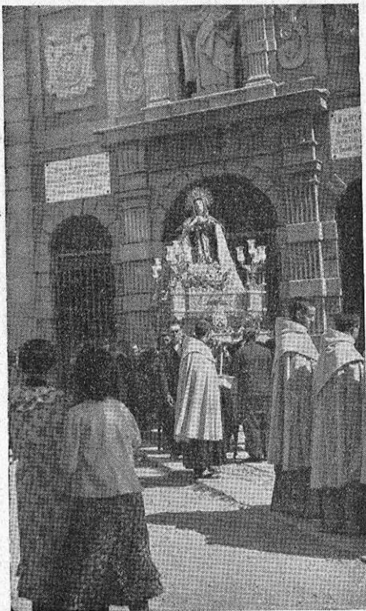
Procesión de la Santa saliendo de su convento.

Santa Teresa, gentil en el ambiente claustral como una flor del pensil monacal. Humorista y reidora, algo zumbona y bromista, era seria pensadora la que fué ínclita Doctora, grave, simpática y lista. Era artista y literata en prosa y en poesía. No era la monja pazguata llena de gazmoñería. No era en todo original. Era una super-mujer esencia de lo genial en el pensar y el querer. Castellana de la estepa del corazón de Castilla, era de tan pura cepa que aún no ha muerto su semilla. Lo prueba la santidad que flotando en el ambiente de esta mística ciudad la perfuma suavemente de su religiosidad.