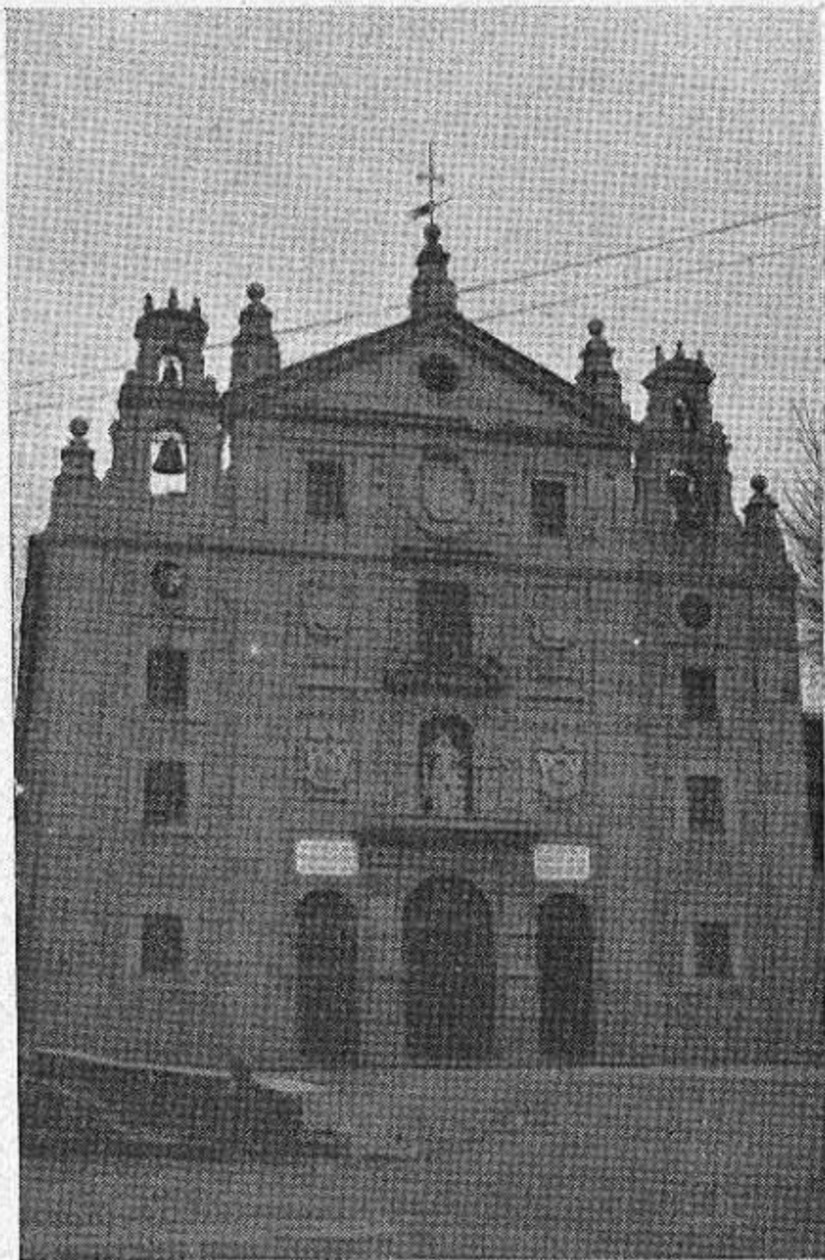
Convento de Santa Teresa

Lo pedía el allanado coso de San Vicente, célebre coso del toreo caballeresco. Si no, se podía dar, en último término, en la plaza de toros. Gestiones se han seguido para que coincidiera con «El día de Ávila» que el centro Abulense de Madrid tiene proyectado y se quiere hacer coincidir con uno de los días 12 ó 13. Para «El día de Ávila», propaganda y compenetración de abulenses residentes en Madrid convertí la obra «El Comedor de Caridad», exhibición de tipos del país en viernes, en otra obra «El día de Ávila», donde, con esta exhibición de tipos se da la de nuestras mujeres históricas: Isabel de Castilla, Santa Teresa dentro de la admirable decoración del Mercado grande antiguo, debida a