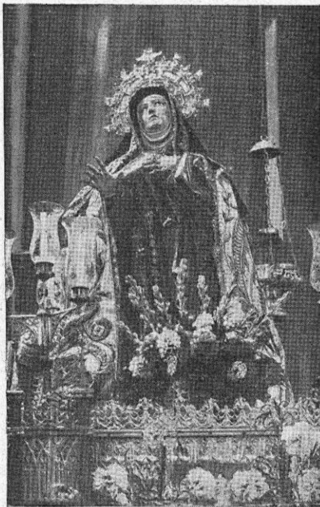
AVILA.—Santa Teresa de Jesús

Por dos veces quise dar la orientación de estas fiestas en la ciudad maravillosa de Teresa de Cepeda. Si intacta está la ciudad, como he dicho, en su aspecto histórica que es, con justicia, monumental, cumple aprovechar este escenario magnífico para evocar los hechos estupendos de sus grandezas. A mi propuesta, por los años