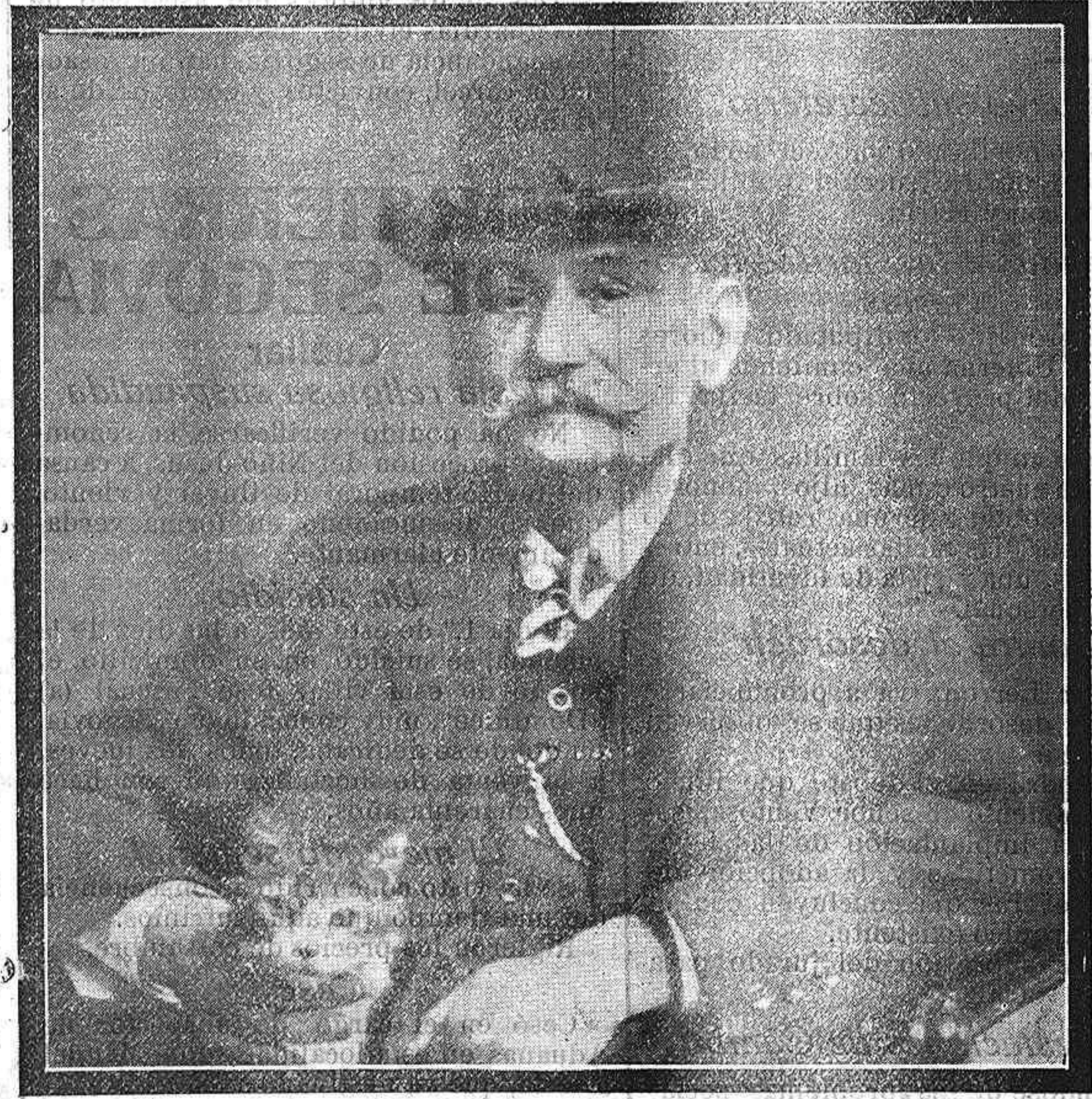
Don Benito Pérez Galdós, ilustre escritor que falleció el día 4 del actual.