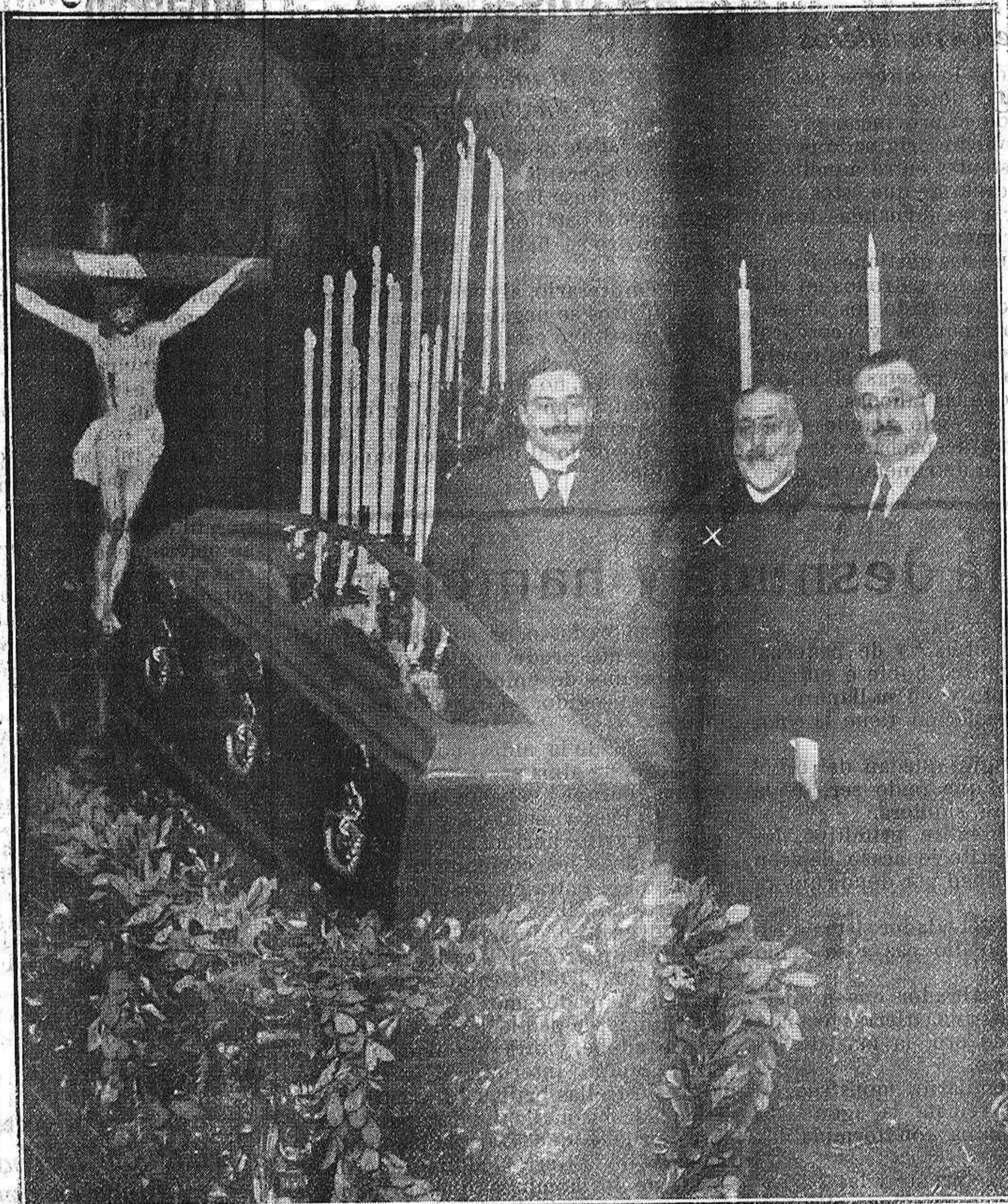
El Presidente del Consejo de Ministros, visitando con el Alcalde de Madrid, la capilla ardiente donde yace el cadáver del señor Pérez Galdós.