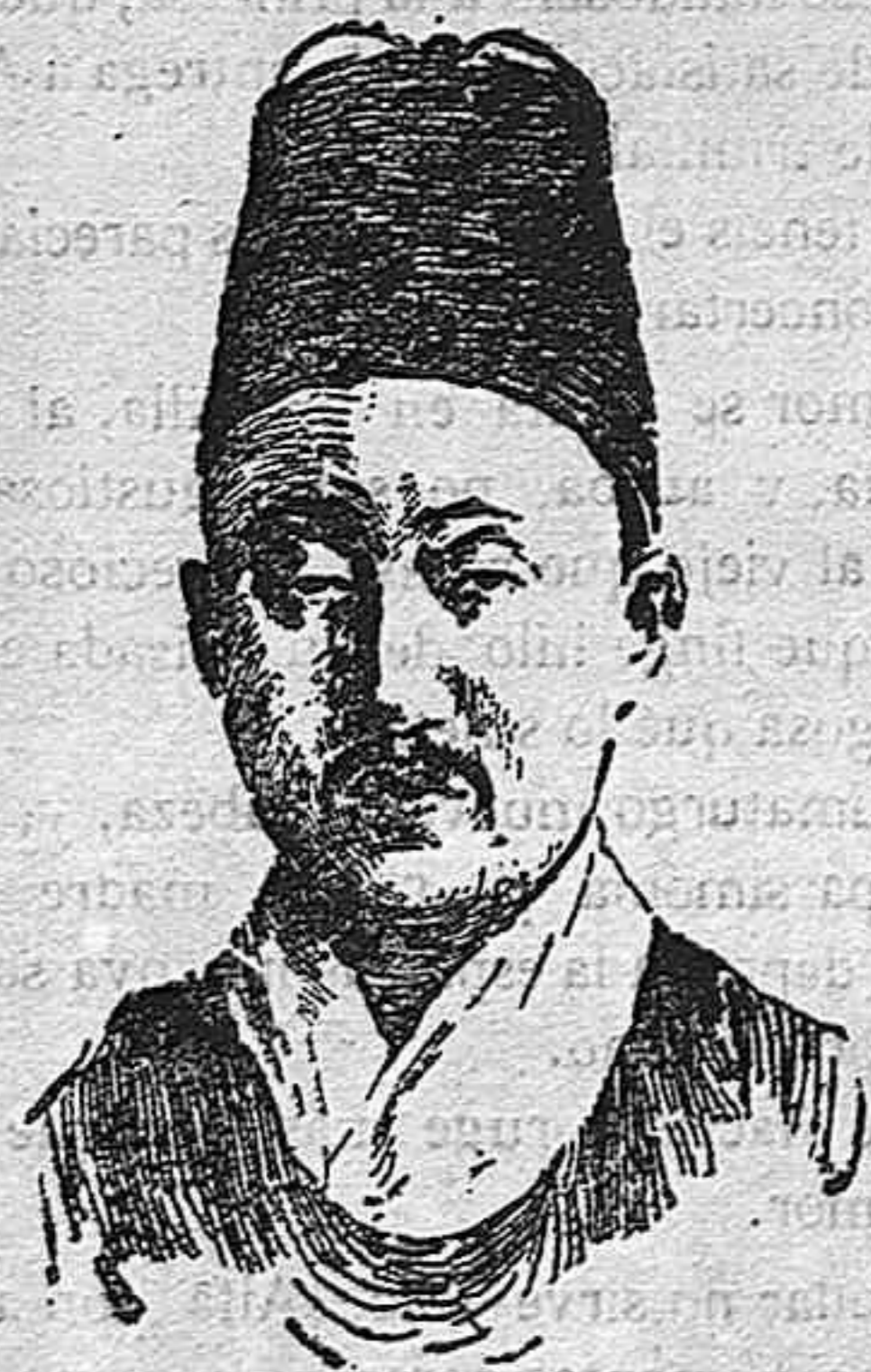
El emperador de Corea, Gy Hyenuj

Aunque no de una manera absoluta, Corea pertenece de hecho al Japón desde hace próximamente tres años, que es el tiempo que sobre ella viene ejerciendo el derecho de intervención.