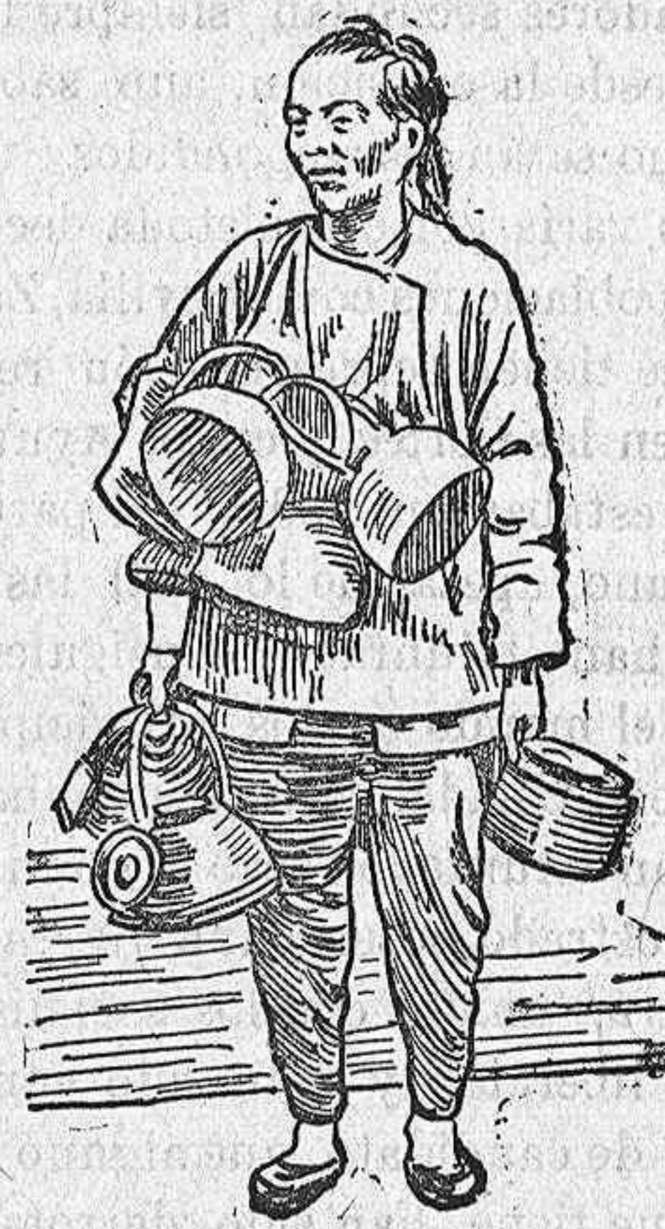
Un hojalatero ambulante