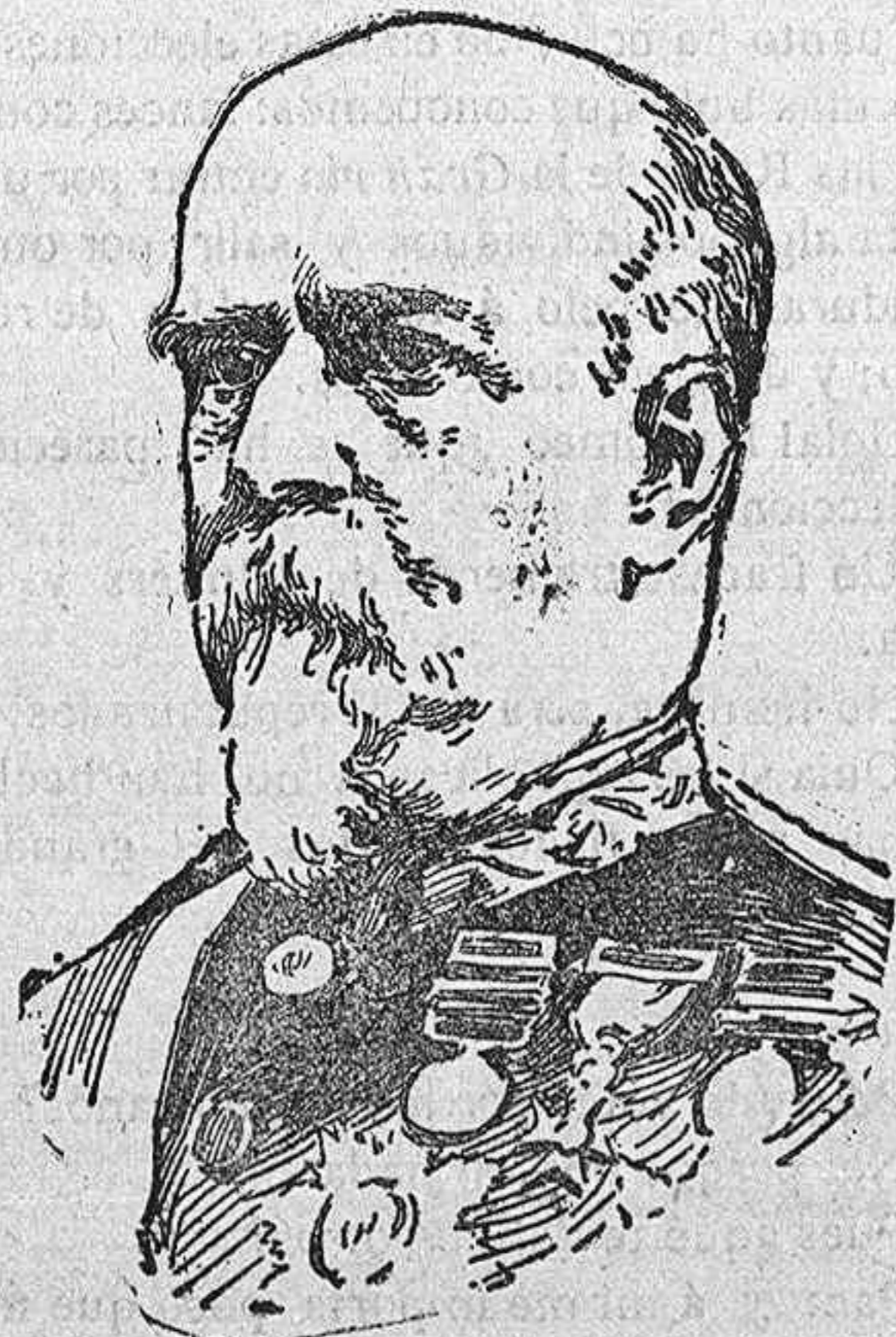
DON MARCELO DE AZCÁRRAGA Y PALMERO Ascendido á Capitán General