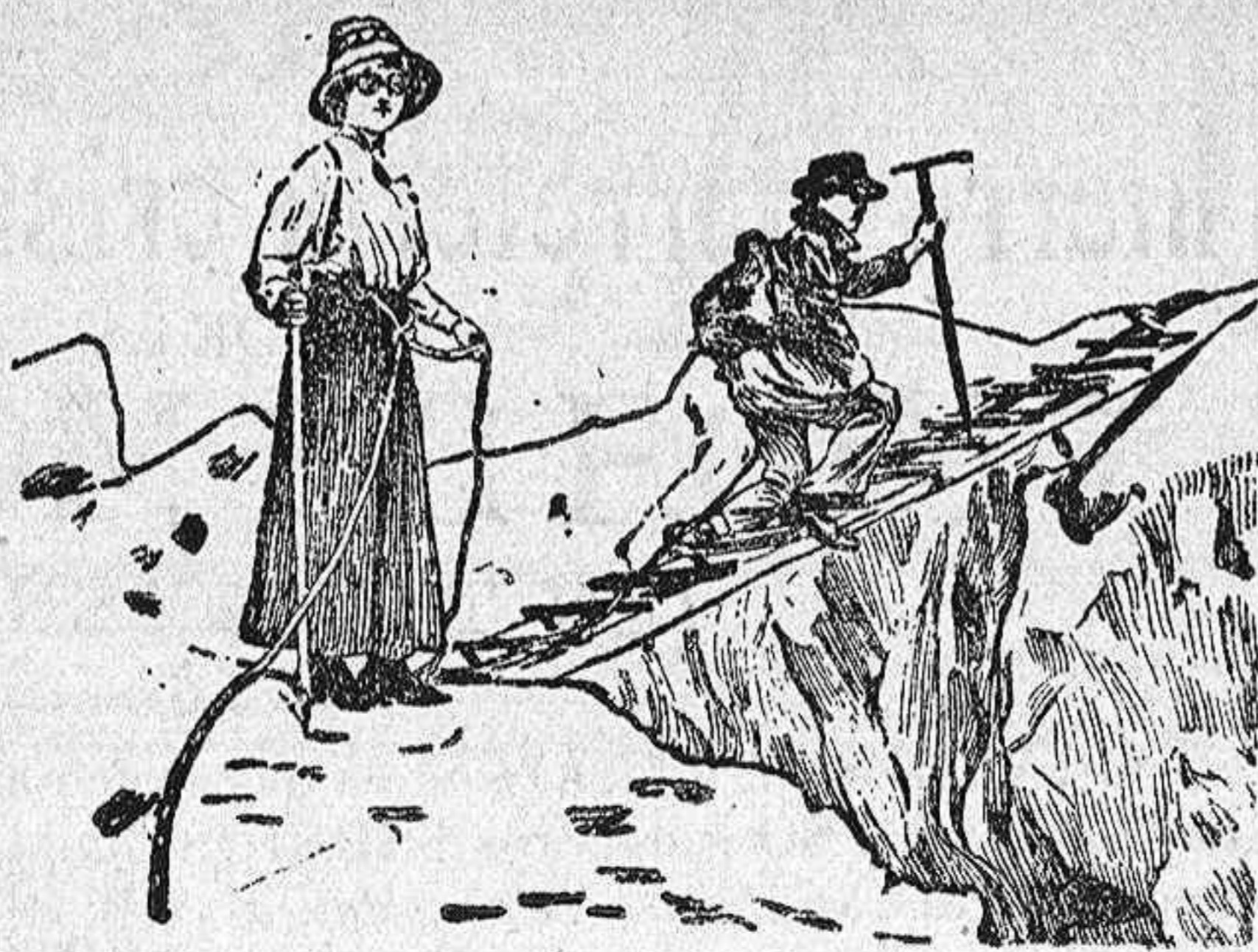
Un paso peligroso

Según unos, la ascensión al Mont Blanc no ofrece ninguna dificultad y puede hacerse sin peligro, á condición de no cometer imprudencias, y según otros, para llevarla á efecto, es preciso poseer una constitución vigorosa, unas piernas de acero, una voluntad férrea y un espíritu que no decaiga ni ante la fatiga ni ante el peligro, y además de todo esto, que no es poco, un guía muy experto, y aun así no está libre de accidentes imprevisos que pueden ser fatales.