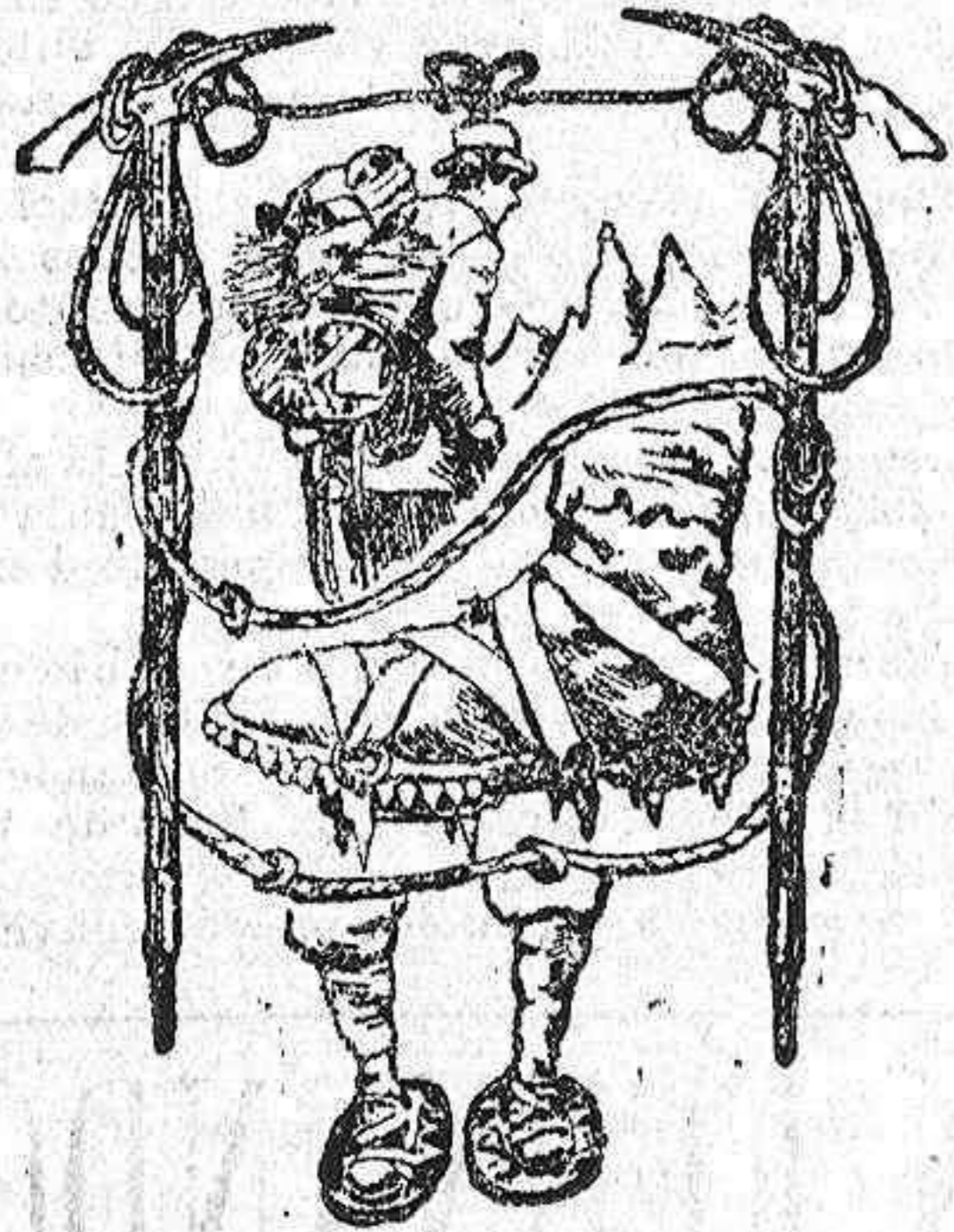
El equipo del alpinista

La primera ascensión al Mont-Blanc data de 1786, y fué hecha por Jacques Balmat. Desde dicho día hasta la fecha, ascienden á muchos millares los alpinistas que han escalado las más elevadas cumbres de los Alpes, y sin embargo el número de los que han pagado su tributo de sangre á la montaña es bien pequeño. La proporción no es alarmante, pues cualquiera otro sport, las carreras de caballos, por ejemplo, ha causado mayor número de víctimas proporcionalmente. Y no decimos nada del automovilismo y menos aún de la aviación.