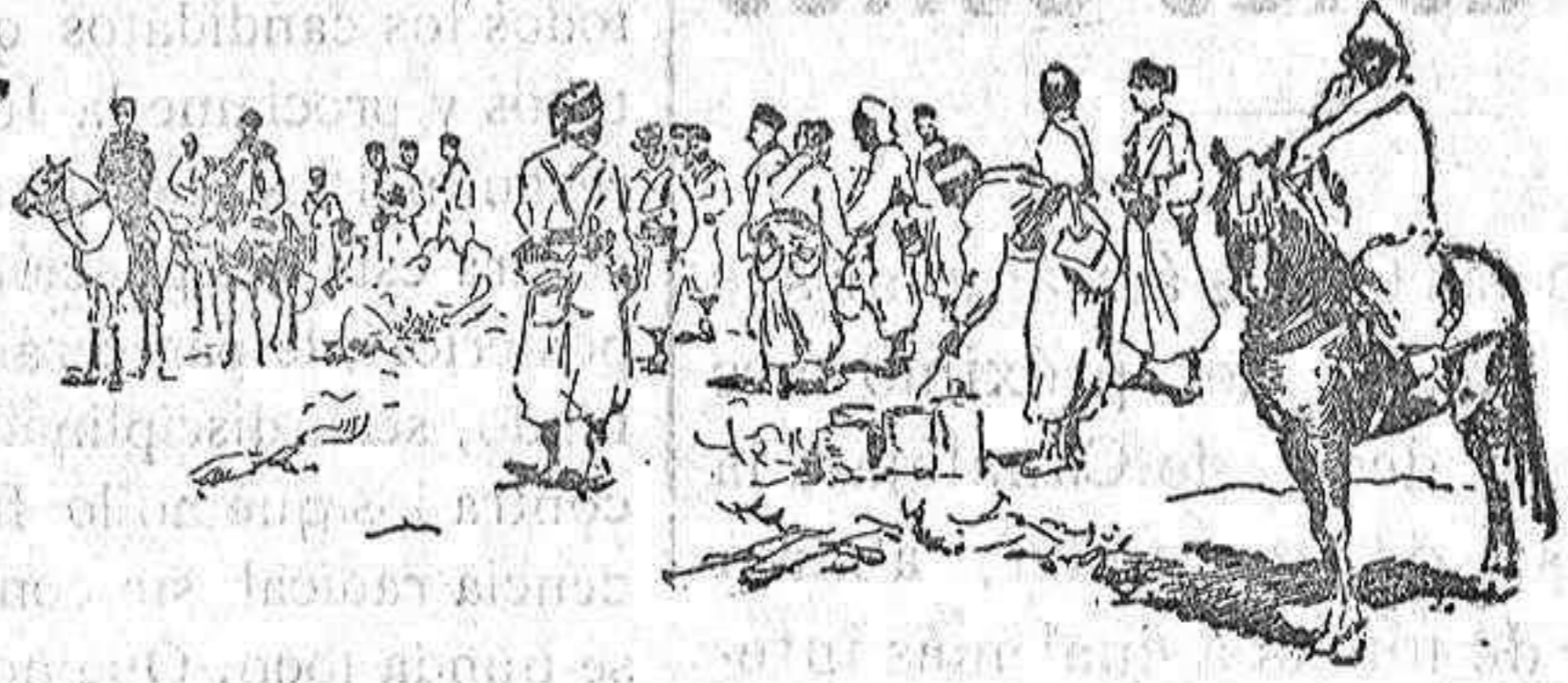
La mealla mandada por oficiales franceses haciéndose la comida.

utilizarla. Al tercer año, como las raíces ya han penetrado en el terreno y son bastante profundas, está, la forrajera en las condiciones debidas para poder ser pastada por los cerdos.