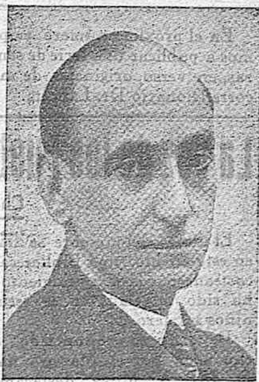
DON SANTIAGO CASARES QUIROGA Republicano insigne. Al frente del Ministerio de la Gobernación del Gobierno Aznárez, se destacó como hombre energético y por eso su mayor gloria es compartir con D. Manuel Aznárez el odio de la reacción derechista. Hoy su nombre se nos presenta, después de una vil campaña de injuria y calumnias, resplandeciente de pureza republicana, de honradez y civismo.