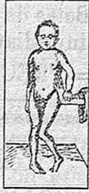
ENFERMEDAD DE LITTE