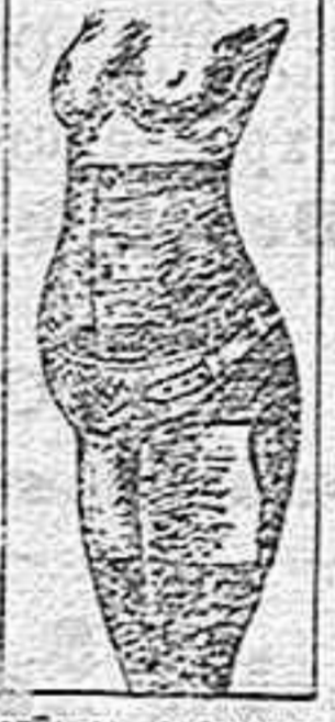
CEJADOR DE PRECISION