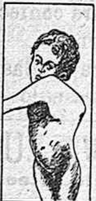
MAL DE POTT - GIBOSIDAD