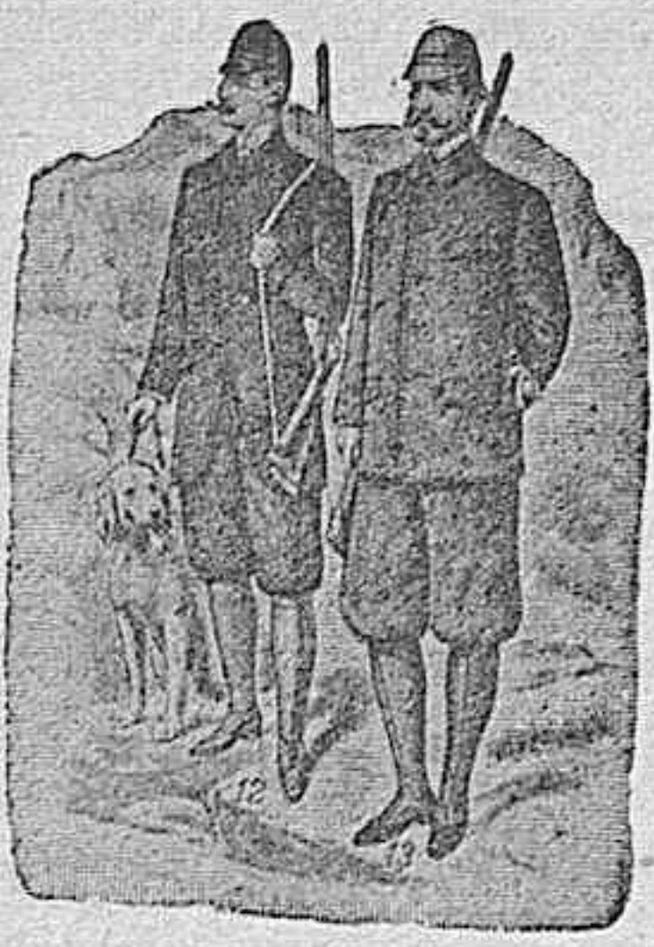
Figura 12.—Traje de chaquet en alpaca inglesa, gris ó negra, pantalón para polaina ó sin ella, 100 pesetas.

Figura 13.—Guayabera en dril del país en diferentes colores y formas 10, 15, 20 y 25 pesetas.