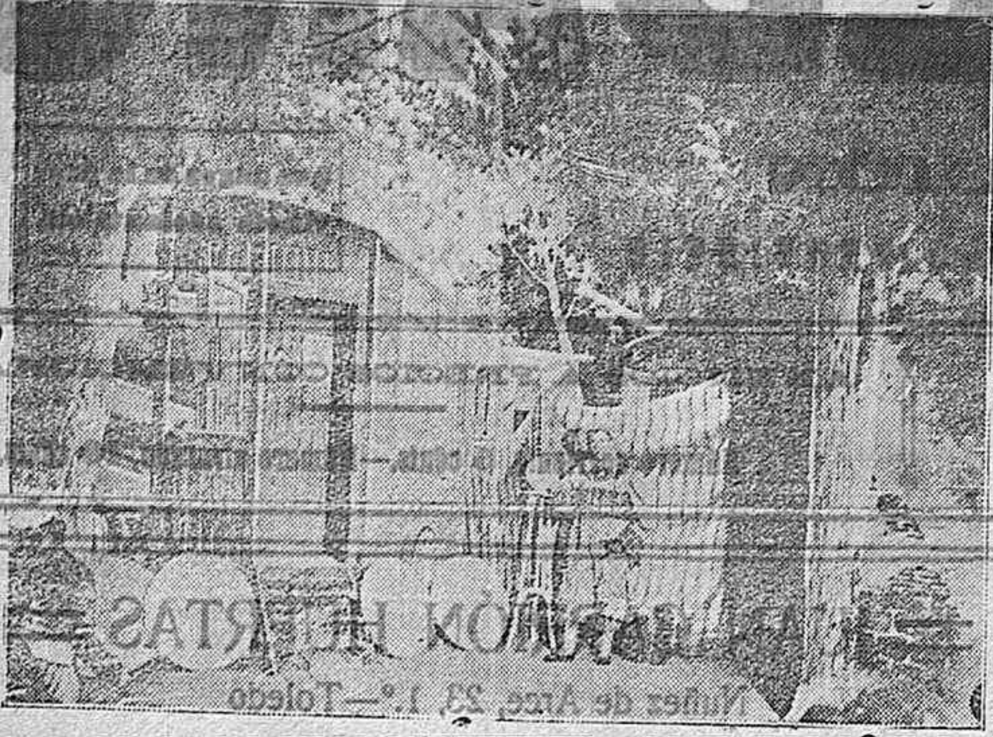
Una escena del primer acto de LAS GOLONDRINAS.

En nuestro número de ayer publicamos hasta la terminación del segundo acto, en un extracto de argumento de esta hermosa obra.