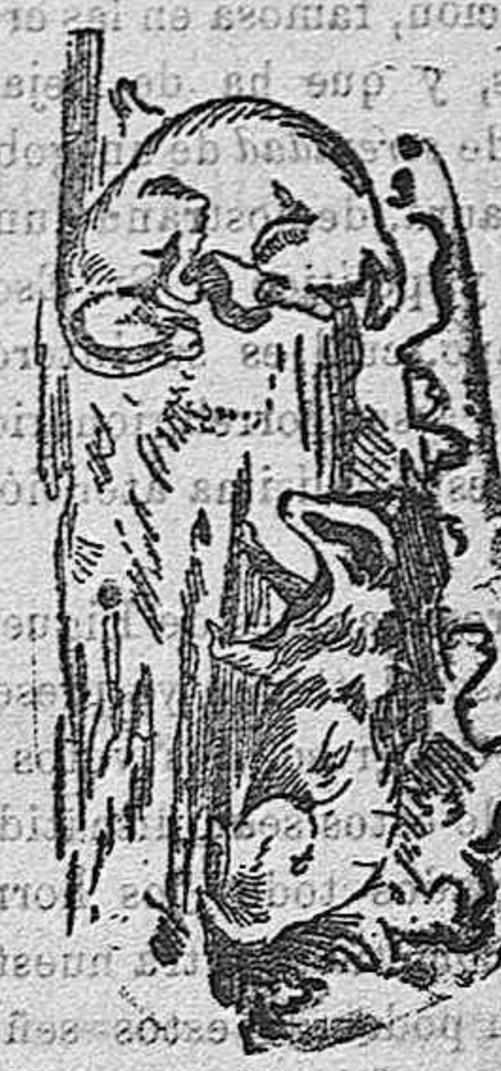
Tejones dando saltos

Todos los felinos, comprendiendo entre ellos el león y el tigre, son jugadores por naturaleza. Lo son también, cuando jóvenes, los animales corpulentos, como el elefante y el rinoceronte.