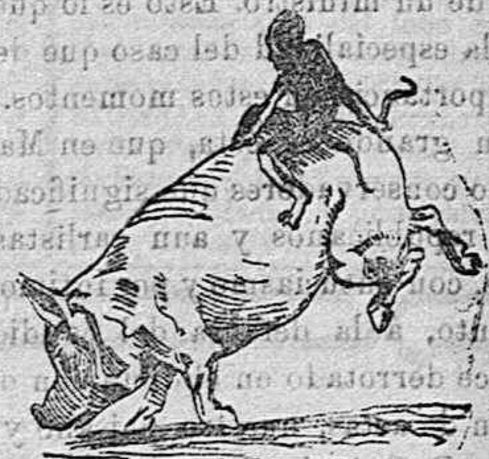
La mona y el cerdo

Los niños tienen dos modos de jugar, ó se entretienen con un objeto inanimado ó bien con otro niño de su misma edad. Los animales hacen lo propio. Sus juegos no son nada complicados, pero revelan un átomo de inteligencia y una viva actividad física. La nutria, por ejemplo, diviértese desahucándose rápidamente por los matorrales cercanos á los ríos, resbalando de manera que su vientre toque en tierra hasta caer en el agua. Luego vuelve á subir para tirarse de nuevo y así sucesivamente hasta que se cansa. Esto prueba que se trata de un juego y no de un medio de bañarse en las aguas del río.