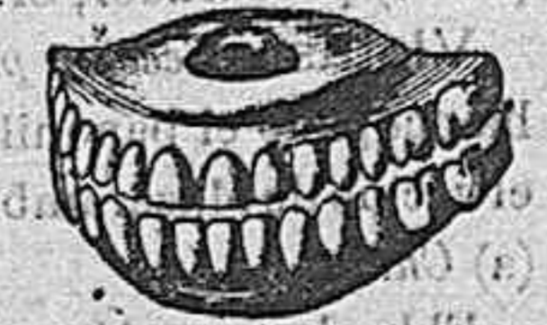
IBÁÑEZ Mecánico dentista

Dentaduras montadas en oro, aluminio y caucho. 3-COASTA DE PAVARITOS-3 MARTES Y MIÉRCOLES CONSULTA GRATIS