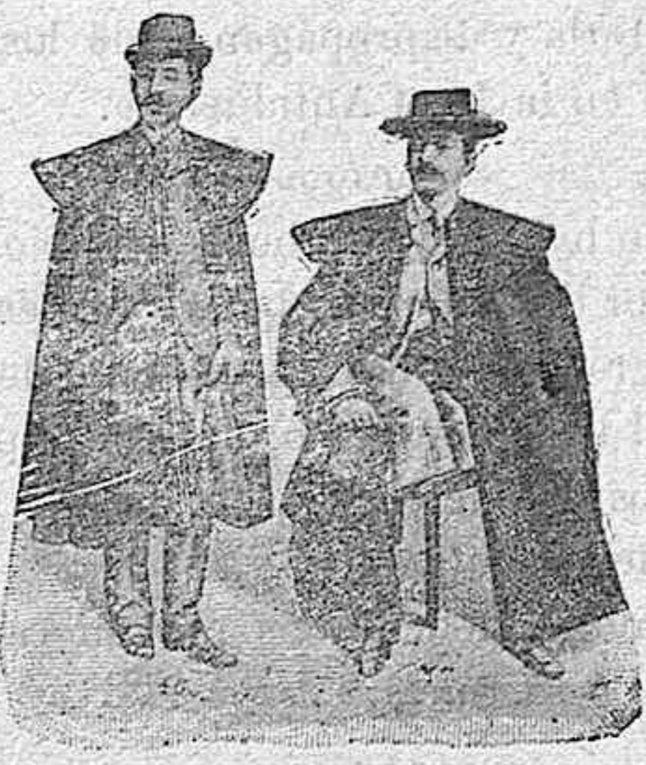
Figura 46.—Capa madrileña, corte y estilo especial de la casa, á 50, 70, 90, 110 y 150 pesetas. Figura 47.—Capa bordada á mano, en paños finos de Béjar, colores garantizados en azul, verde ó café, dibujos diferentes desde 150, 200, 250 á 400 pesetas.