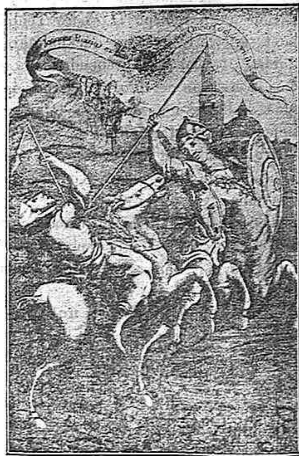
Disputa entre los defensores del rito mozárabe y los del romano.—Grabado de época.

Así, pues, muchos de ellos no abandonaron las ciudades en que vivían, sino que al capitular