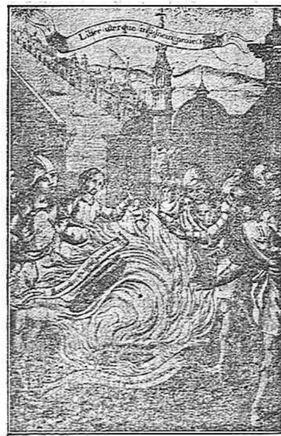
Prueba del fuego para averiguar el rito que debía prevalecer en Toledo.—Grabado de época.