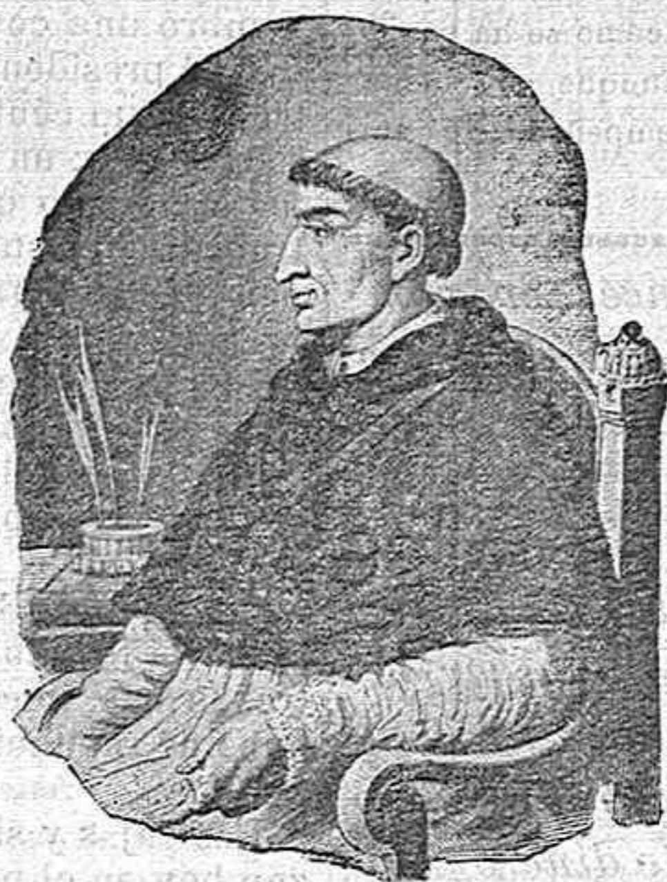
Verdadero retrato del Cardenal Cisneros.

Atento exclusivamente a la prosperidad de la Patria, mostró una energía que, a juicio de los mundanos, es incompatible con la humildad de los discípulos del Crucificado, pero que es característica de los que, vencidas sus pasiones, no tienen más señores que la verdad y la justicia. Atajó el desvario y la soberbia de la nobleza, combatió la debilidad o arbitrariedad de los Príncipes, sofocó las rebeliones de los descontentos, cortó las ambiciones de los extraños, dignificó la condición de los humildes y procuró el bienestar de todos. Para impedir la desunión de los Estados de Castilla y Aragón logró que heredara la corona de ambos dominios D. a Isabel, mujer de D. Manuel de Portugal e hija mayor de Isabel la Católica, y para mantener la descendencia española, supo hacer después que esta corona pasara a las siénes de los Archiduques de Austria D. Felipe y D. a Juana, hija también de la Reina Católica.