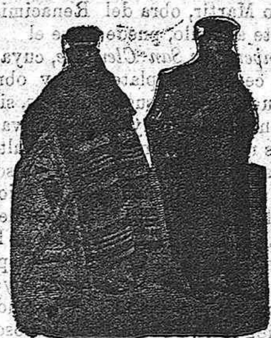
Fig. 32.—Capote segoviano, color café y rojo, de mucho abrigo, impermeabilizado, cuello de piel y capucha caoutchouc, 60 pesetas.—Fig. 33.—Capote palentino, café con blanco, formando mangas, cuello de piel, capucha portátil, 70 pesetas.