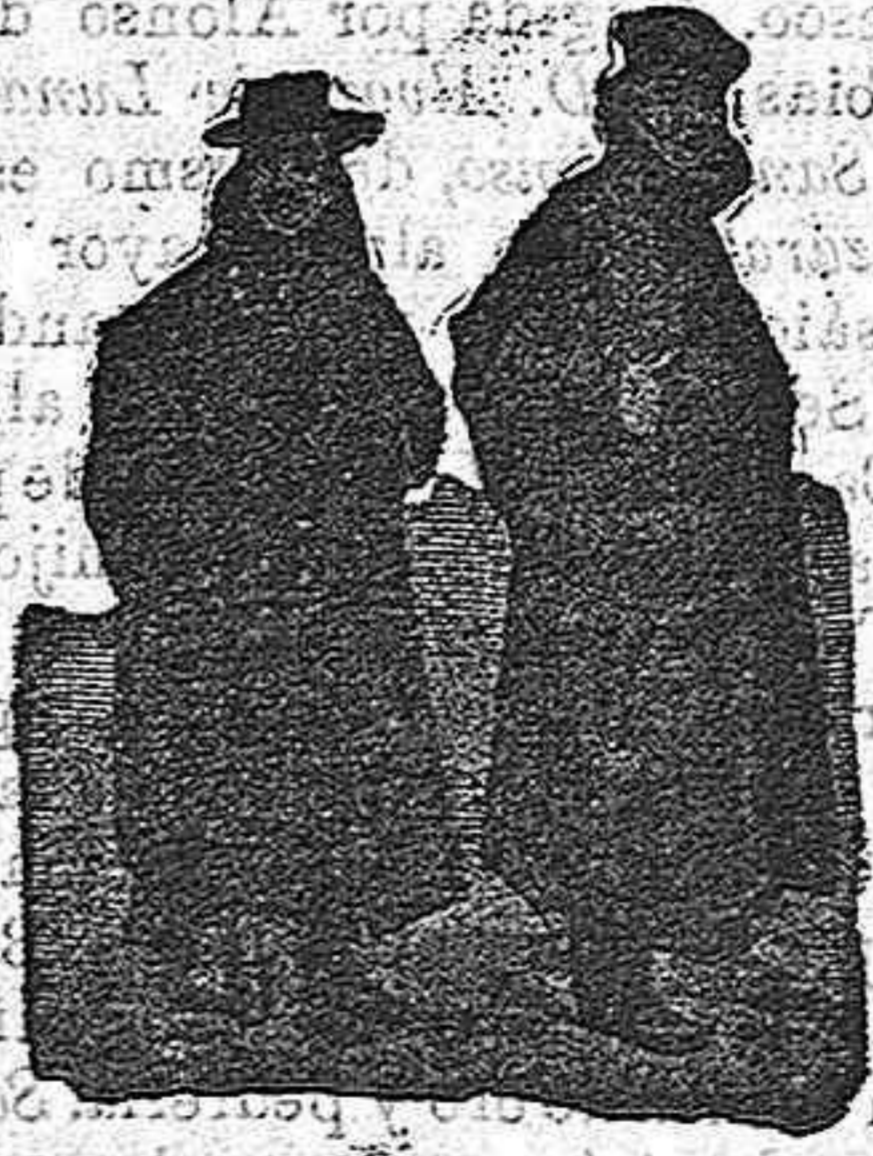
Fig. 30.—Capote sevillano, gris oscuro, impermeabilizado, las caídas y aberturas de atrás están bordadas con paño, cuello de piel y capucha, 90 pesetas.—Fig. 31.—Capote abulense, gris y blanco, impermeabi- lizado, cuello de piel, capucha caoutchouc, 60 pesetas.

De nuestro catálogo de prendas de caza, campo y sport.