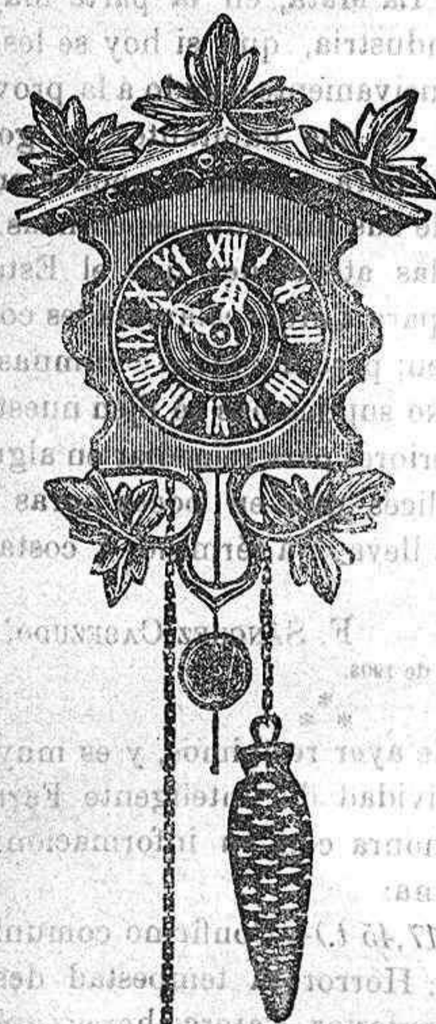
El reloj de regalo para los suscriptores de

Contra Calenturas Rebeldes Píldoras Antipílicas del Dr. Sánchez Cabezudo. Se venden por Cajas á 6 pesetas, y 3 id. media en todas las FARMACIAS Depósito en Madrid: Borrel Hermanos, Puerta del Sol, 5.