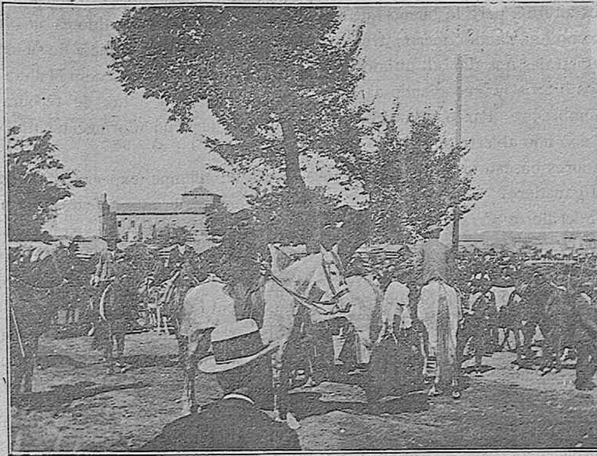
Vista parcial de la feria.