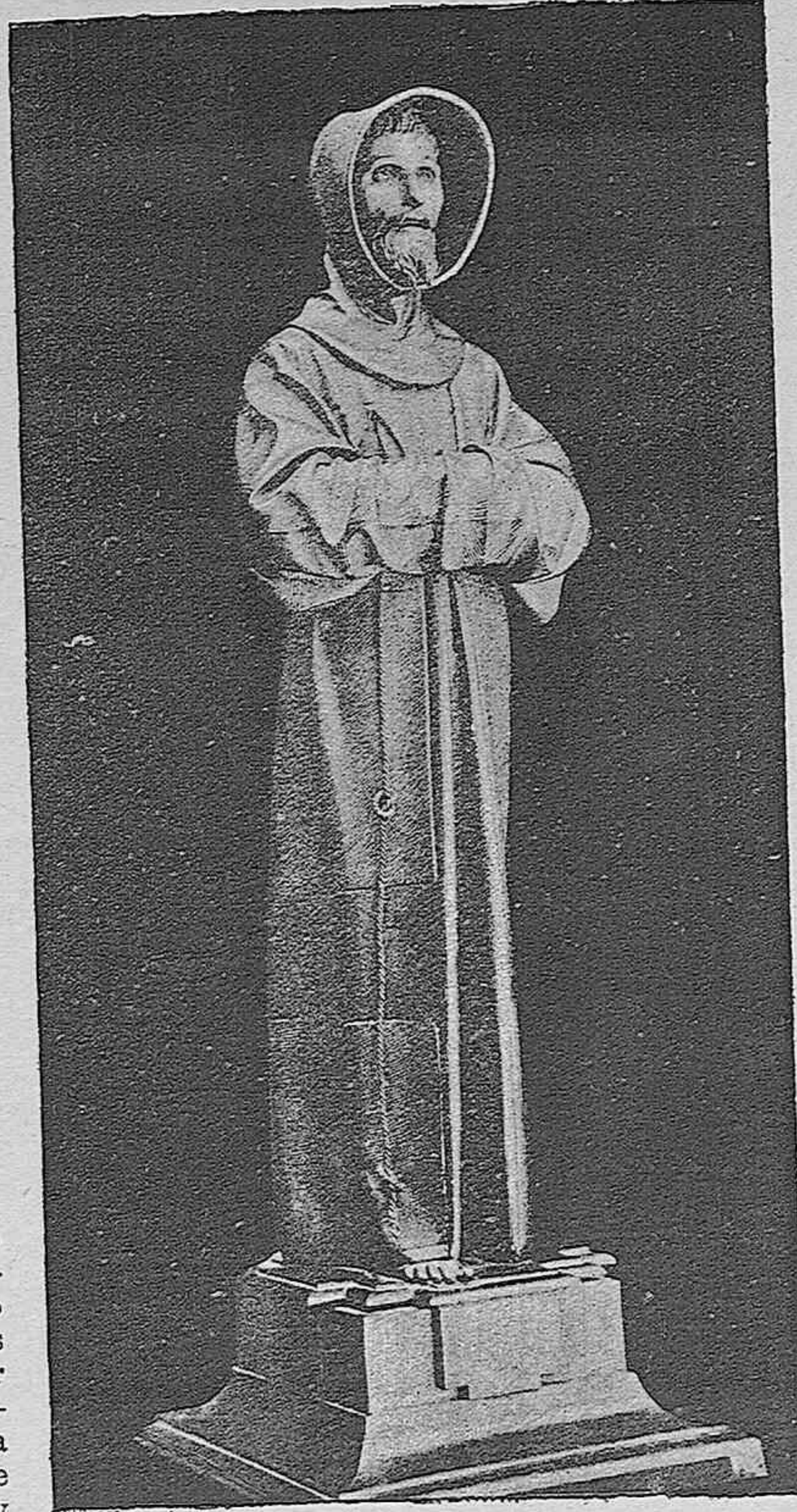
San Francisco, escultura de la Catedral