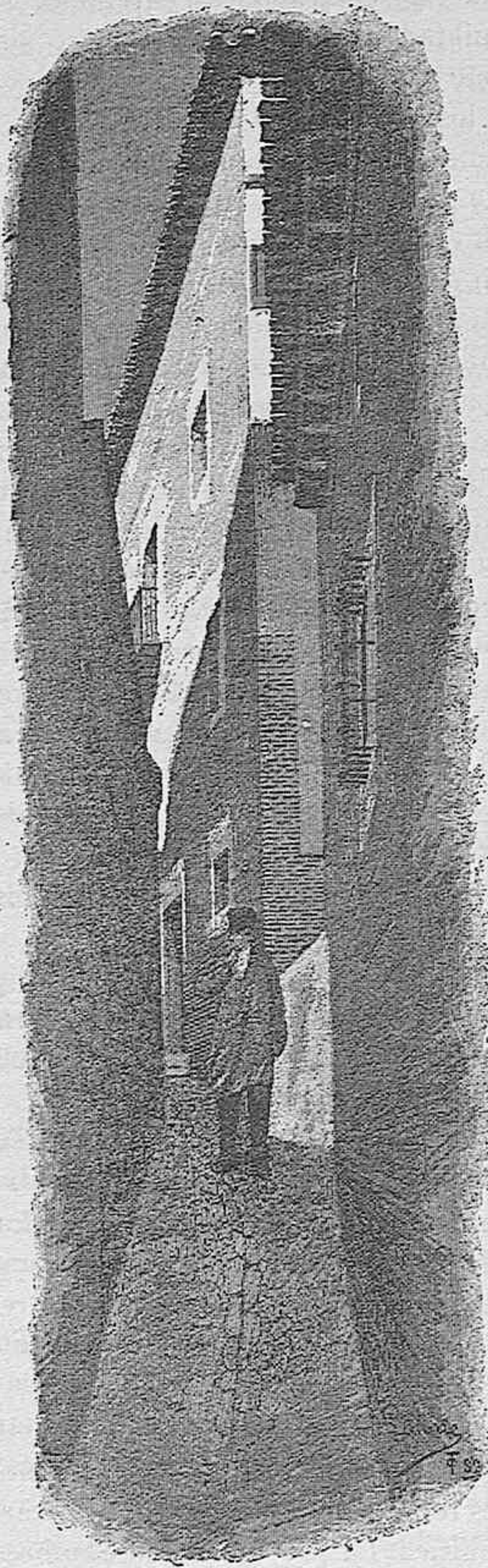
Callejón del Toro (Toledo)

Acompañándolos, vendrían juglares lombardos y bretones, los más notables á la sazón, siquiera en pago de las visitas que los nuestros les hicieran en sus países respectivos. Y del mutuo comercio de unos y otros, nacieron á mi ver aquellos dos poemas anónimos: el Libre dels tres reys d'Orient y la Vida de Madona Santa María Egipcíaca , de fraseología políglo-