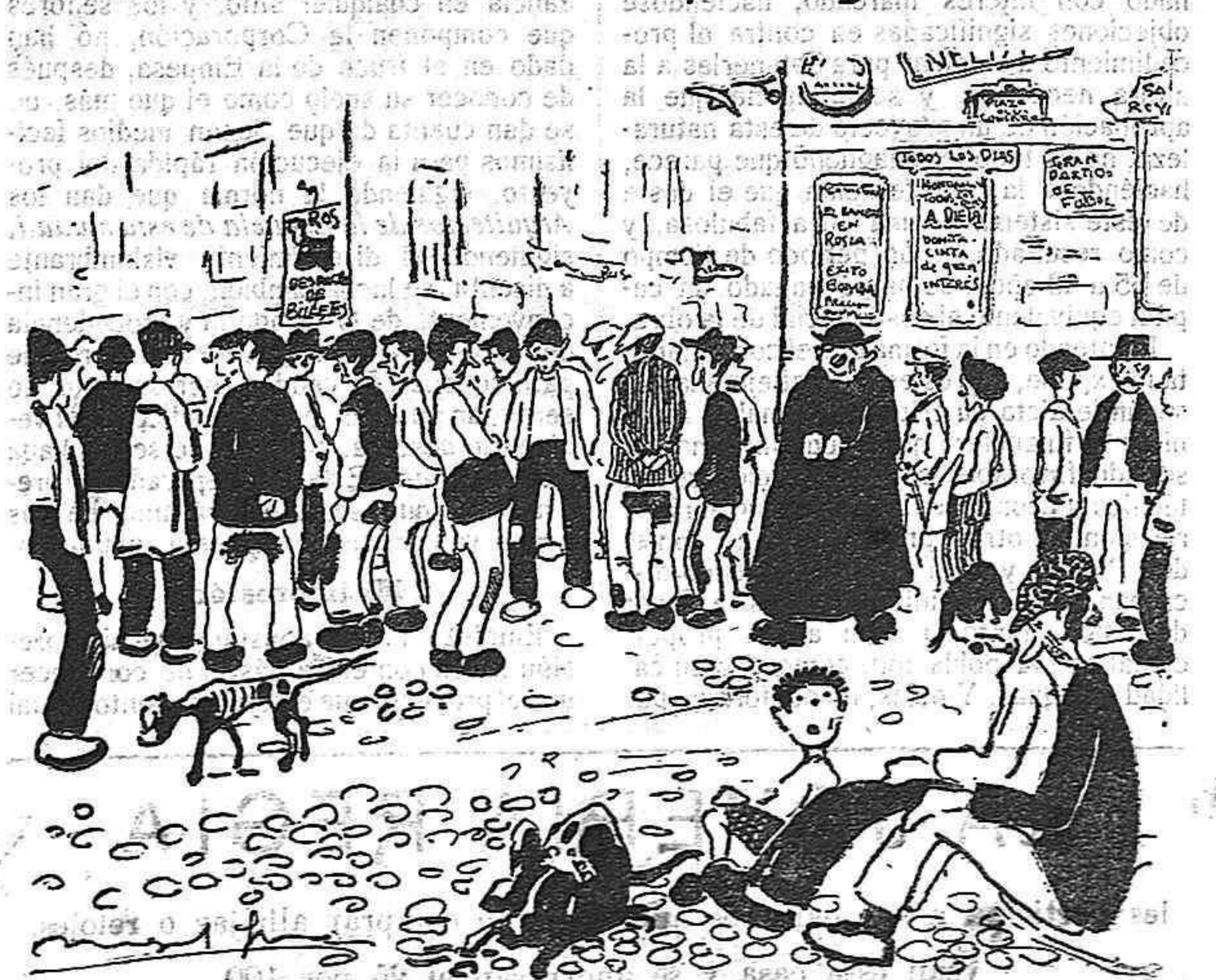
Este grupo que véis aquí, está cansado de buscar trabajo y no lo encuentra. ¿Dónde estará?