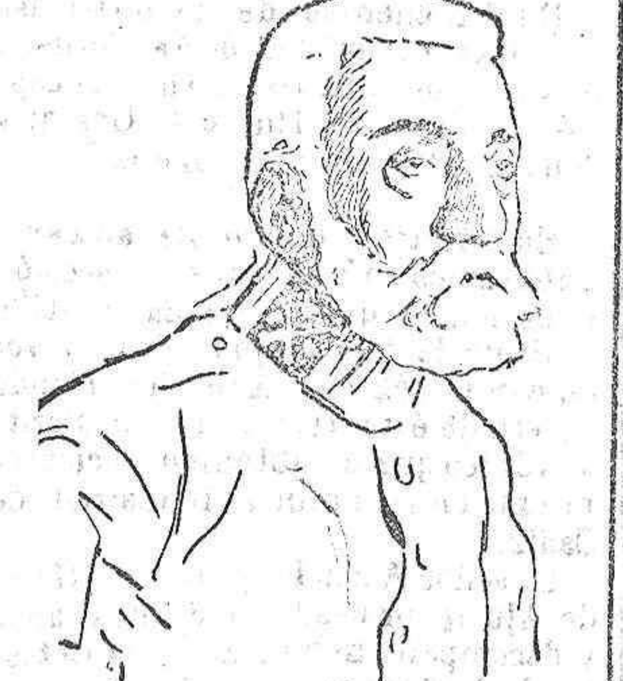
El exministro de la Guerra, general Luque, que se halla visitando nuestras posesiones de Marruecos.