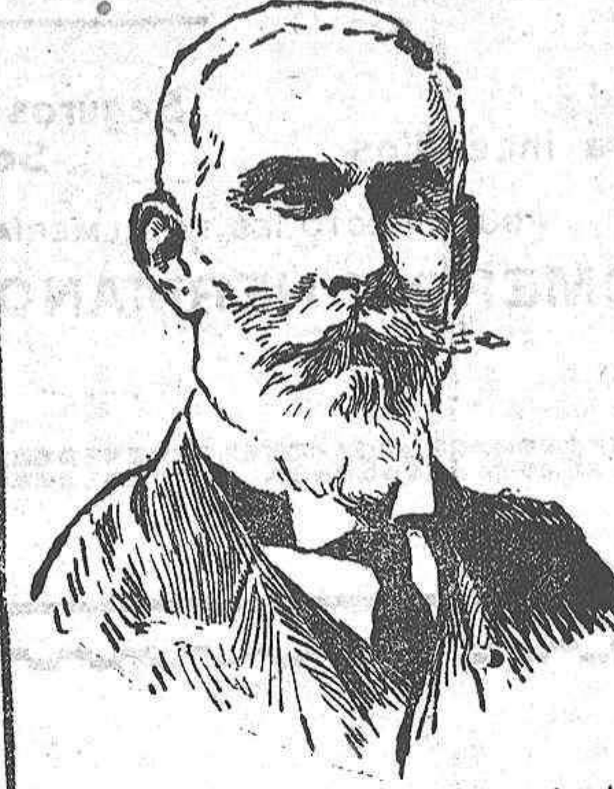
Don Rafael Altamira, representante de España en Paris ante el Tribunal arbitral que entiende las cuestiones sobre asuntos de Marruecos.