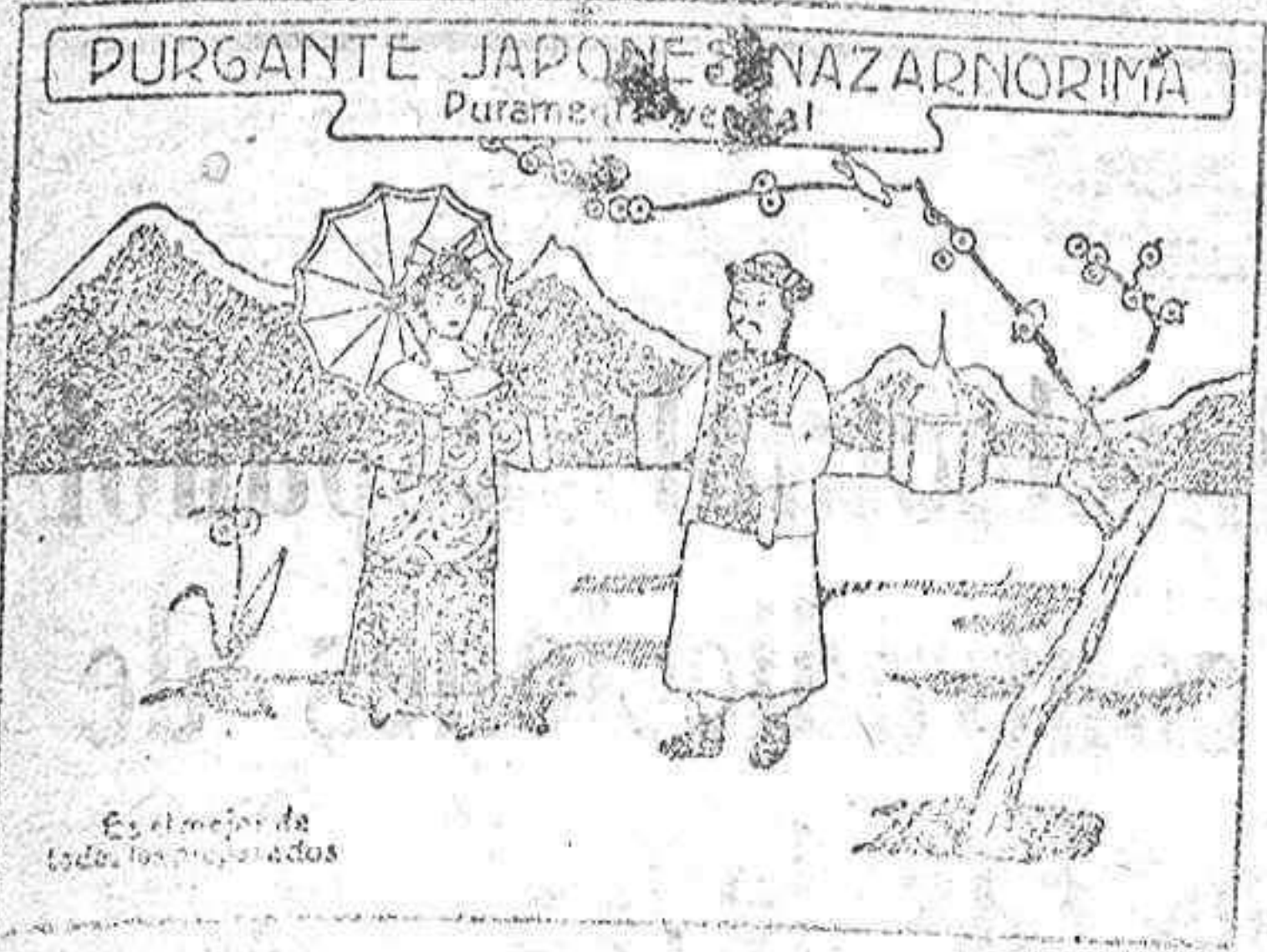
Sello Japonés 'Gimen',

Puede tomarse también tal como está preparado, sin disolverlo en líquido alguno; basta echarse a la boca y tomar un sorbo de agua, tila, etc, etc., etc., resultando en este caso de sabor riquísimo. Solo cuesta 25 céntimos.