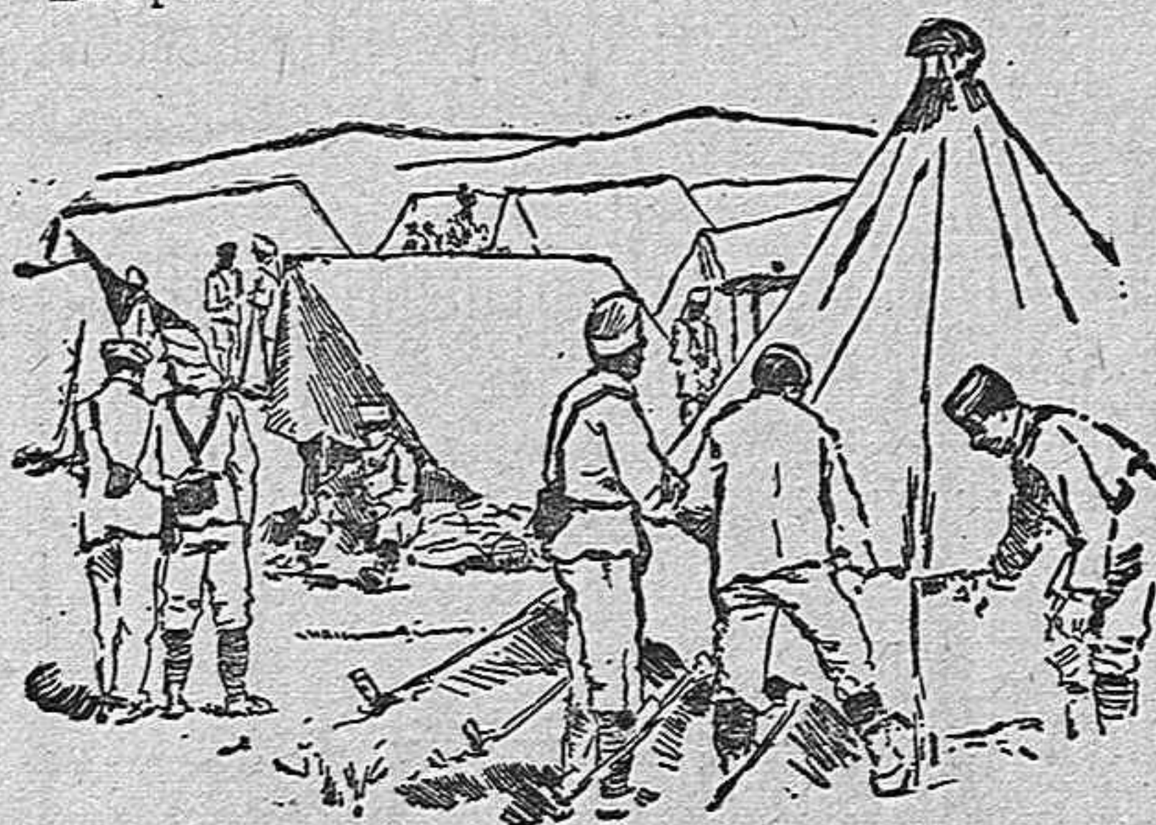
Instalando un campamento en Rostro-gordo.

La opinión está impaciente y esperando de un