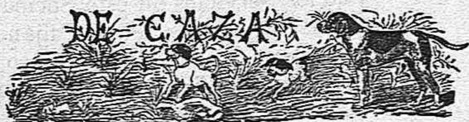
San Martín de la Montaña.

Las últimas cacerías de la temporada, se irán celebrando como anunciaba en el pasado número.