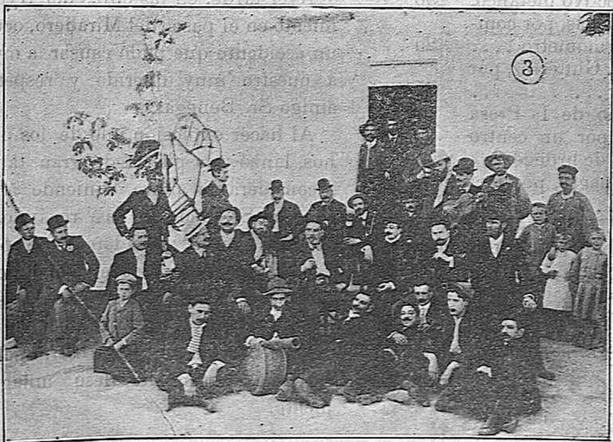
Los de la gira.