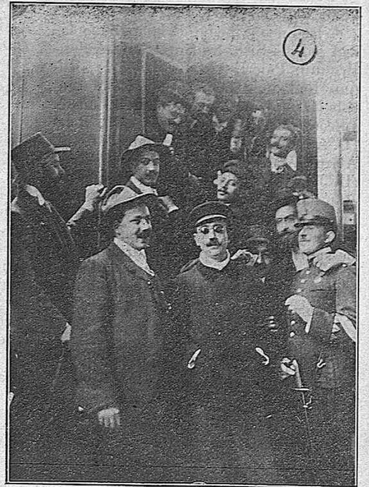
En el andén.