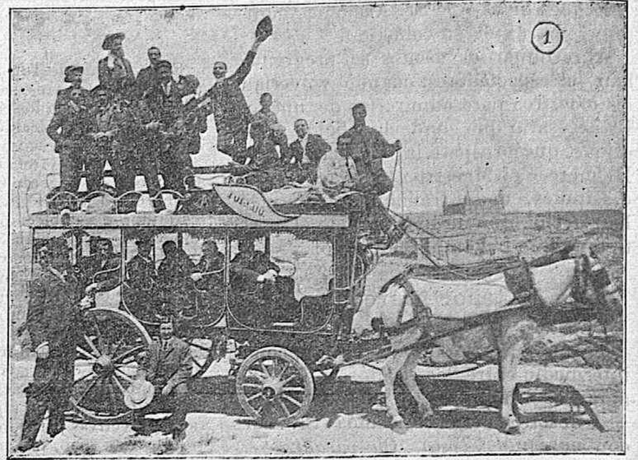
Camino de La Sísia.

Isidrin y Roque vienen á ser con el florete y con la espada lo que Afrodísio con el sable. Rápidos en la parada y en la contestación, veloces en los ataques combinados que desconciertan al adversario, son los dos con distinto tempe-