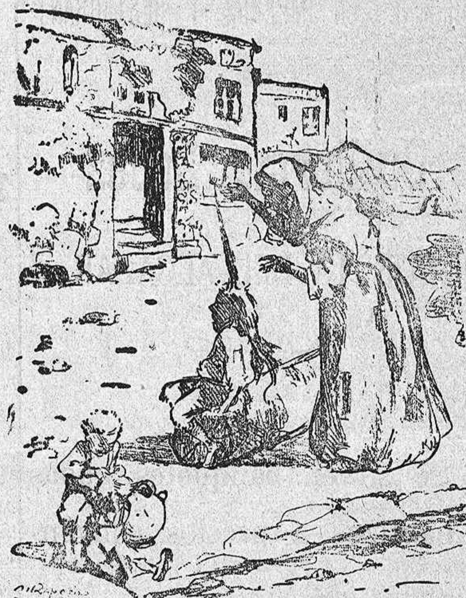
EL PAIS DE LOS PIOJOS

Cómo nos tratan en el extranjero. (Caricatura publicada recientemente por un periódico francés)