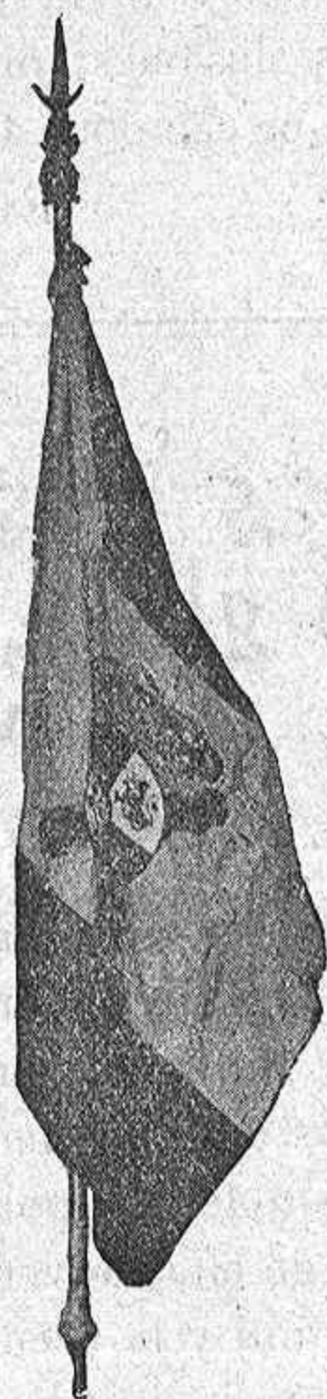
La Bandera de la Academia.