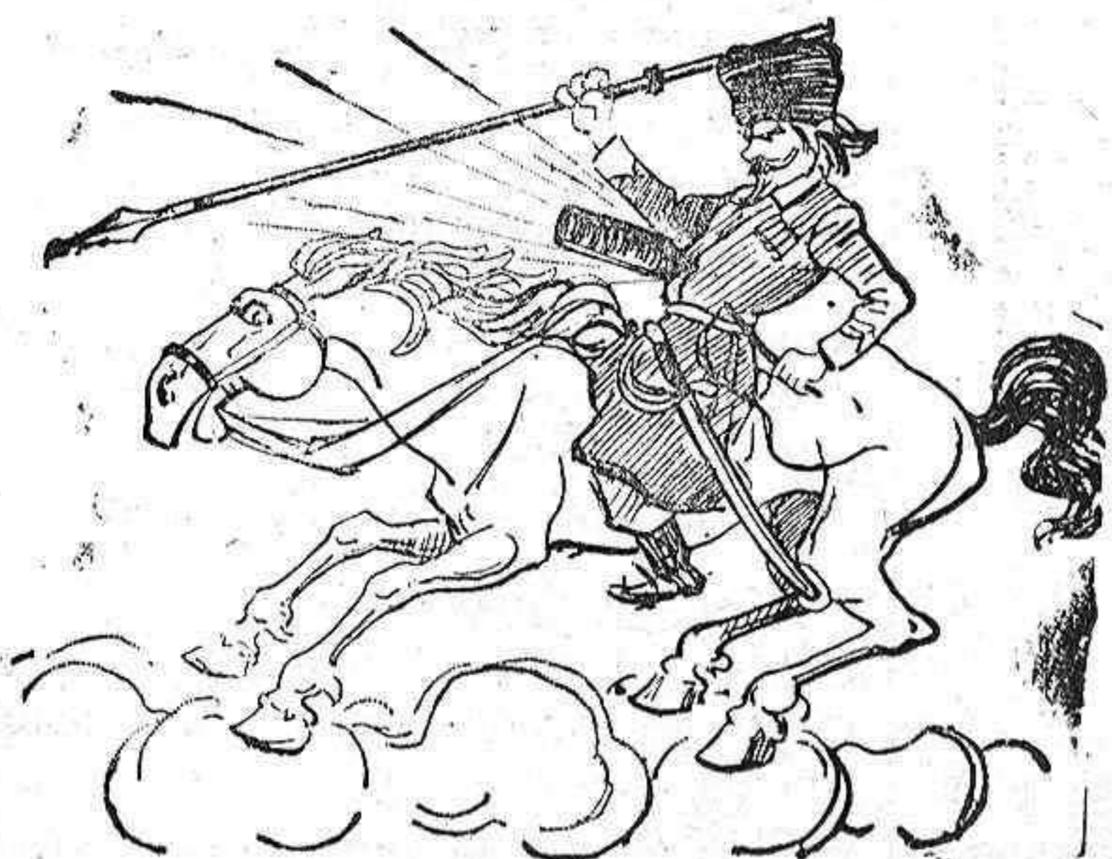
EL COSACO EN CAMPAÑA

¡Demonio! El médico me ha mandado que tome hierro, pero no á dosis tan grandes.