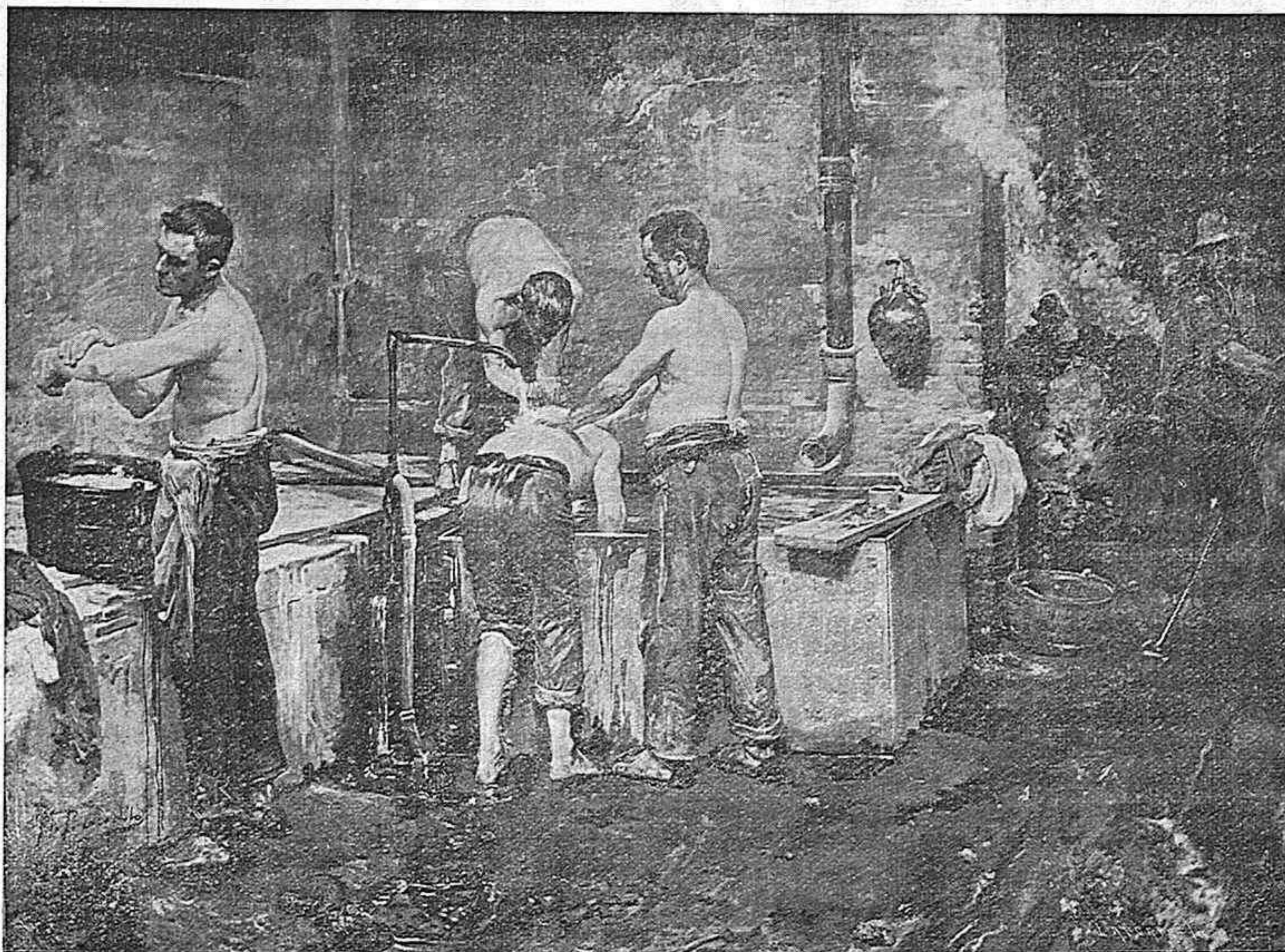
EL ASEO DESPUÉS DEL TRABAJO (Cuadro de M. Bénédicto).