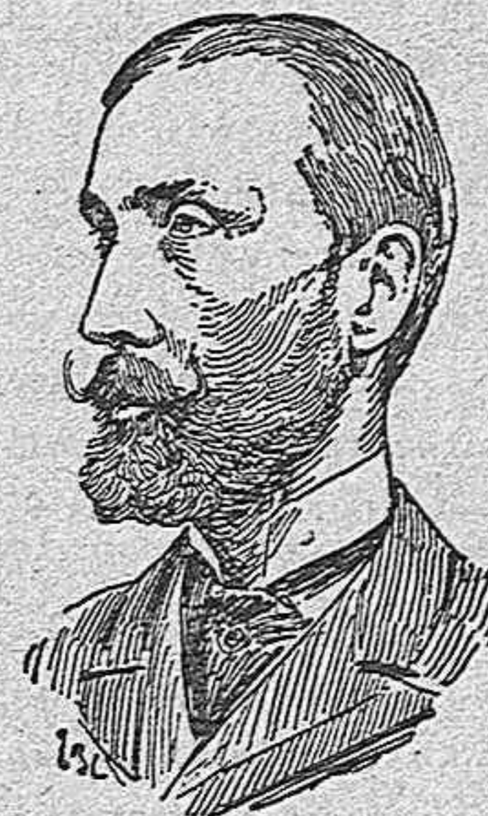
El subsecretario D. José Herrero.

La impresión de los que acompañaban al ministro, acerca de las buenas disposiciones de éste respecto á la conservación del tesoro artístico de Toledo, son excelentes, y todo hace creer que las personas y organismos á ello llamados, se disponen á prestar á este importantísimo objeto, toda la atención que merece y requiere.