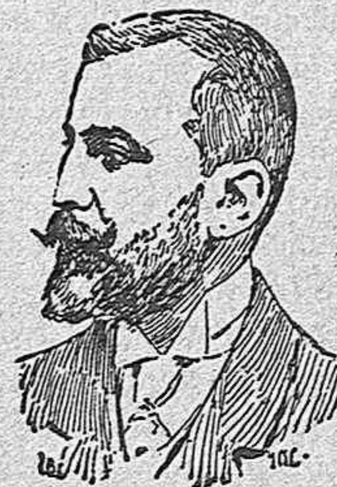
El ministro de Instrucción Pública y Bellas Artes Sr. Jimeno.