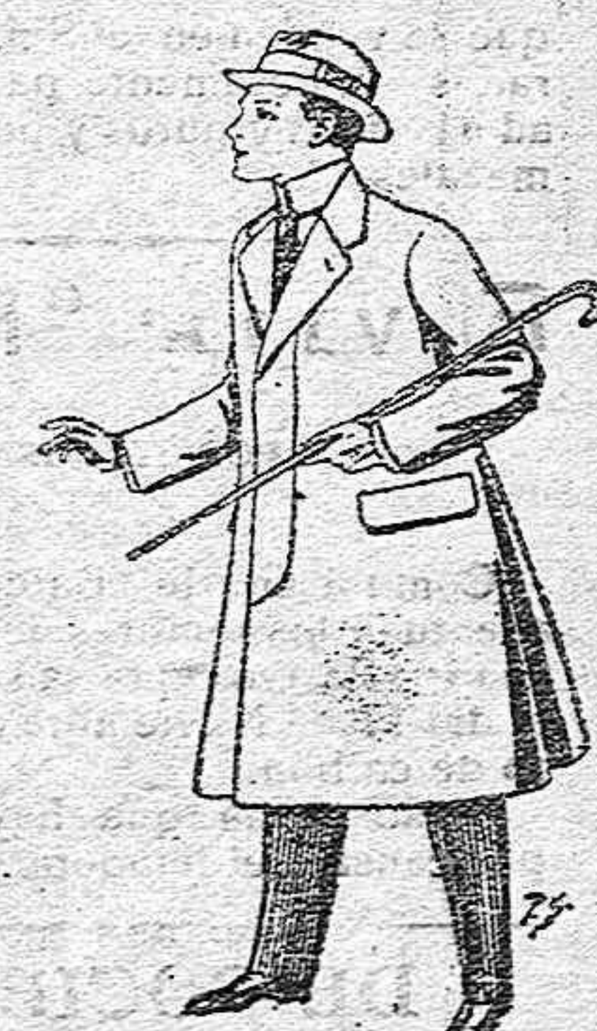
Gabanes de lana, vigonia o melton, con forros saten o seda, para niños de 10 a 12 años, de pesetas 20 a 53.