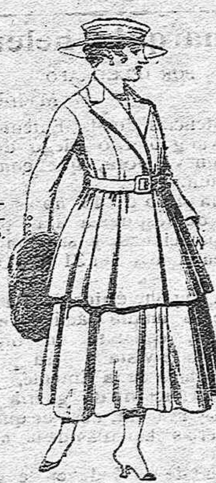
Traje de lana para señora, en color negro y azul, de pesetas 65 a 100.