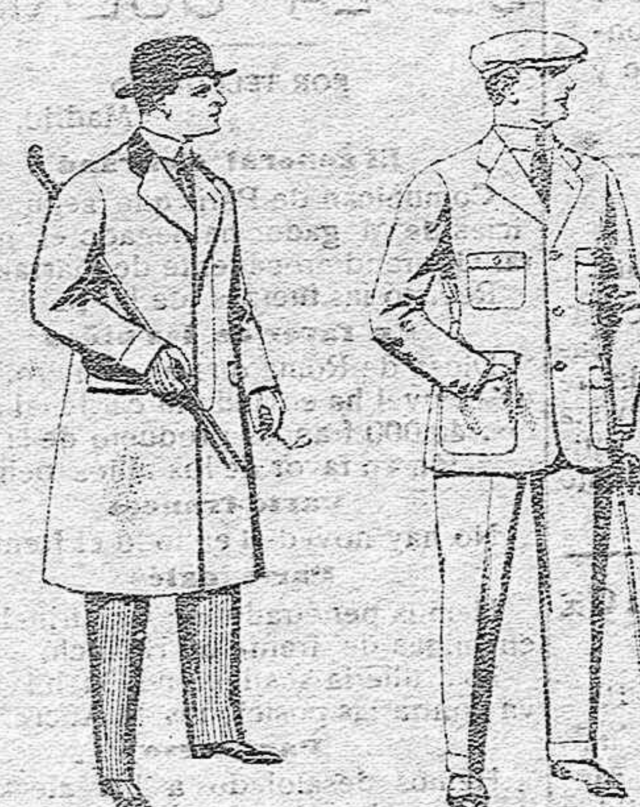
Gabanes de paten, melton y cheviot, con forros seda, saten o escocés, de pesetas 33 a 100. Trajes de cheviot, corte elegante, para sportman, de ptas. 45 a 55.