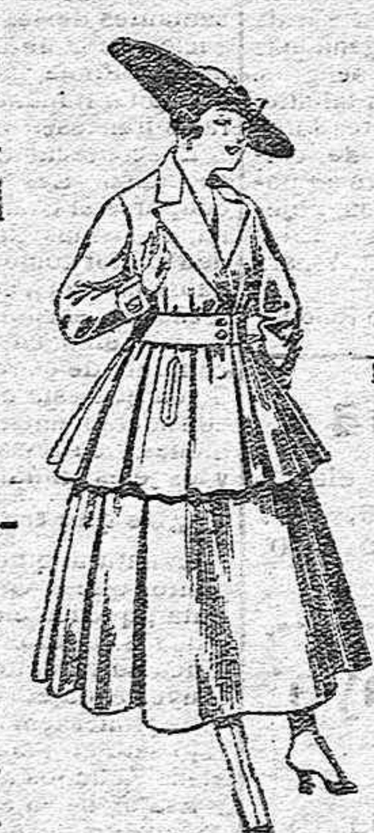
Traje de lana, en negro, azul y color, para señora, de pesetas 90 a 100.