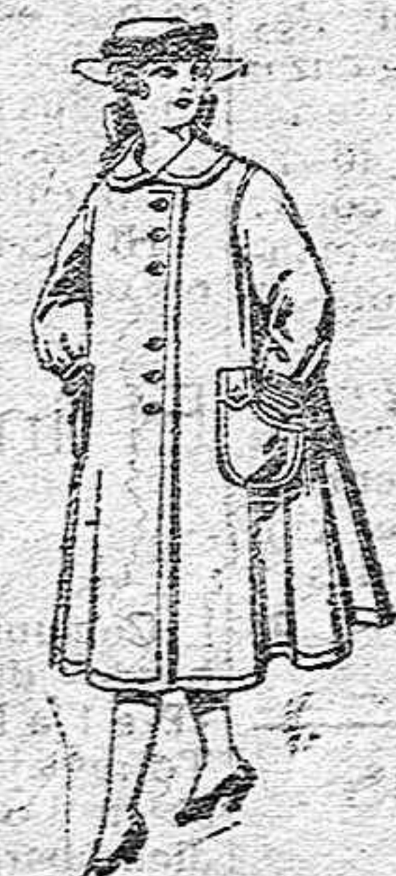
Abrigos de lana para jovencitas de 11 a 15 años, de ptas. 35 a 40.