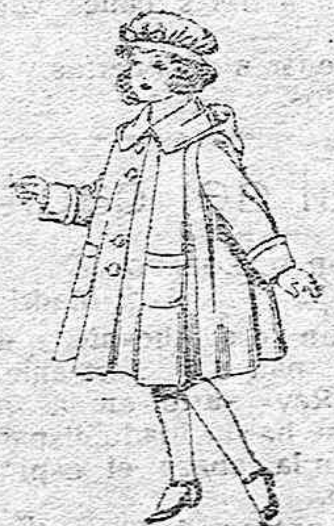
Abrigos de paten, para niñas de 4 a 9 años, de pesetas 22 a 33.