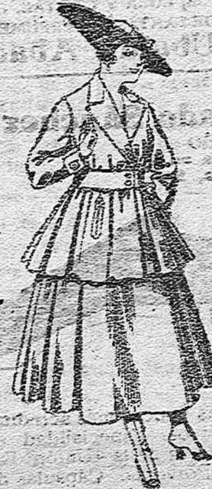
Traje de lana, en negro, azul y color, para señora, de pesetas 90 a 100.

Paletaría, Camisería, Géneros de punto, Corbatería, Guantería, Sombrerería, Zapatería, Paraguas, Bastones y Artículos de Viaje.