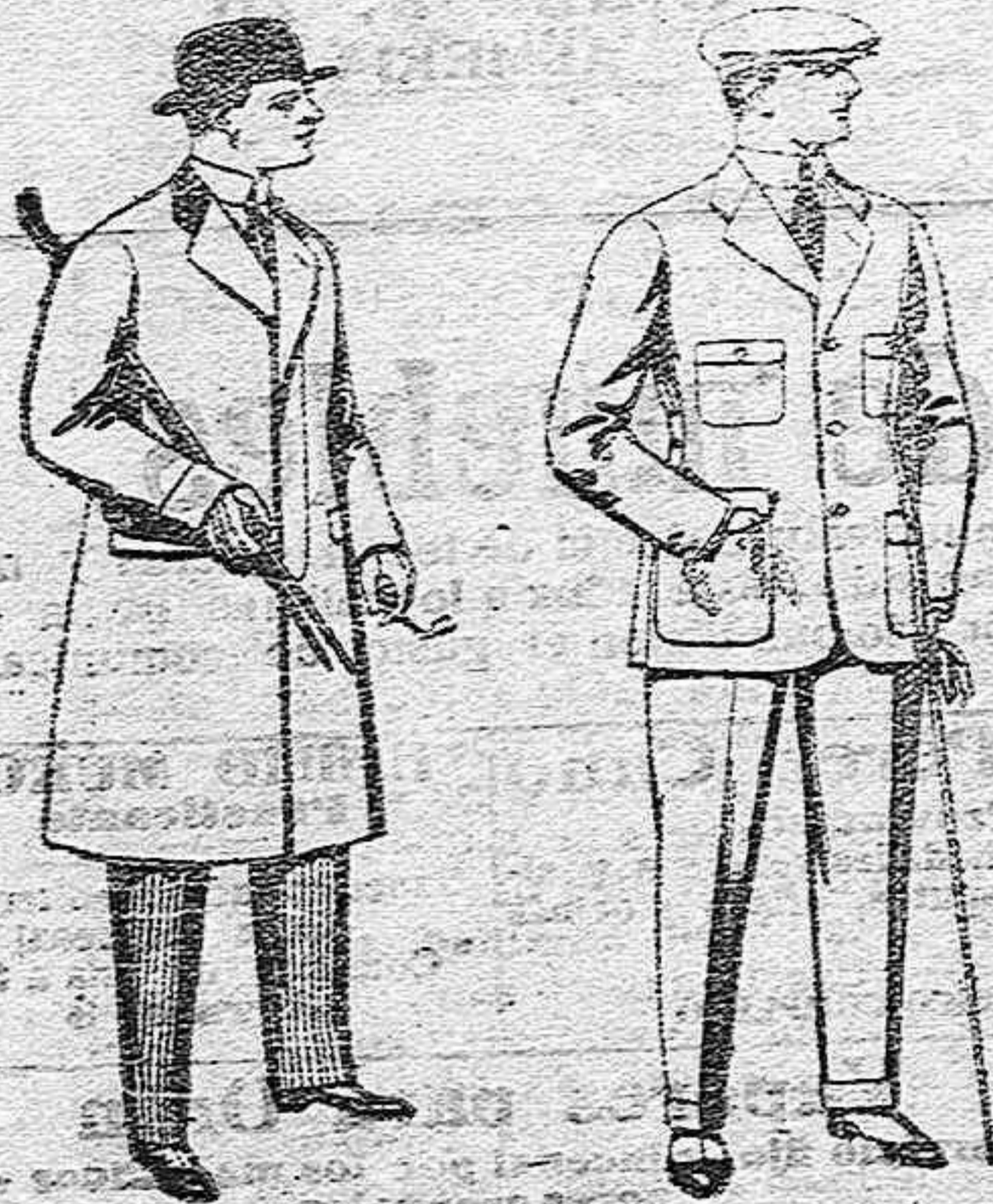
Gabanes de paten, melton y cheviot, con forros seda, caten o escocés, de pesetas 33 a 100.