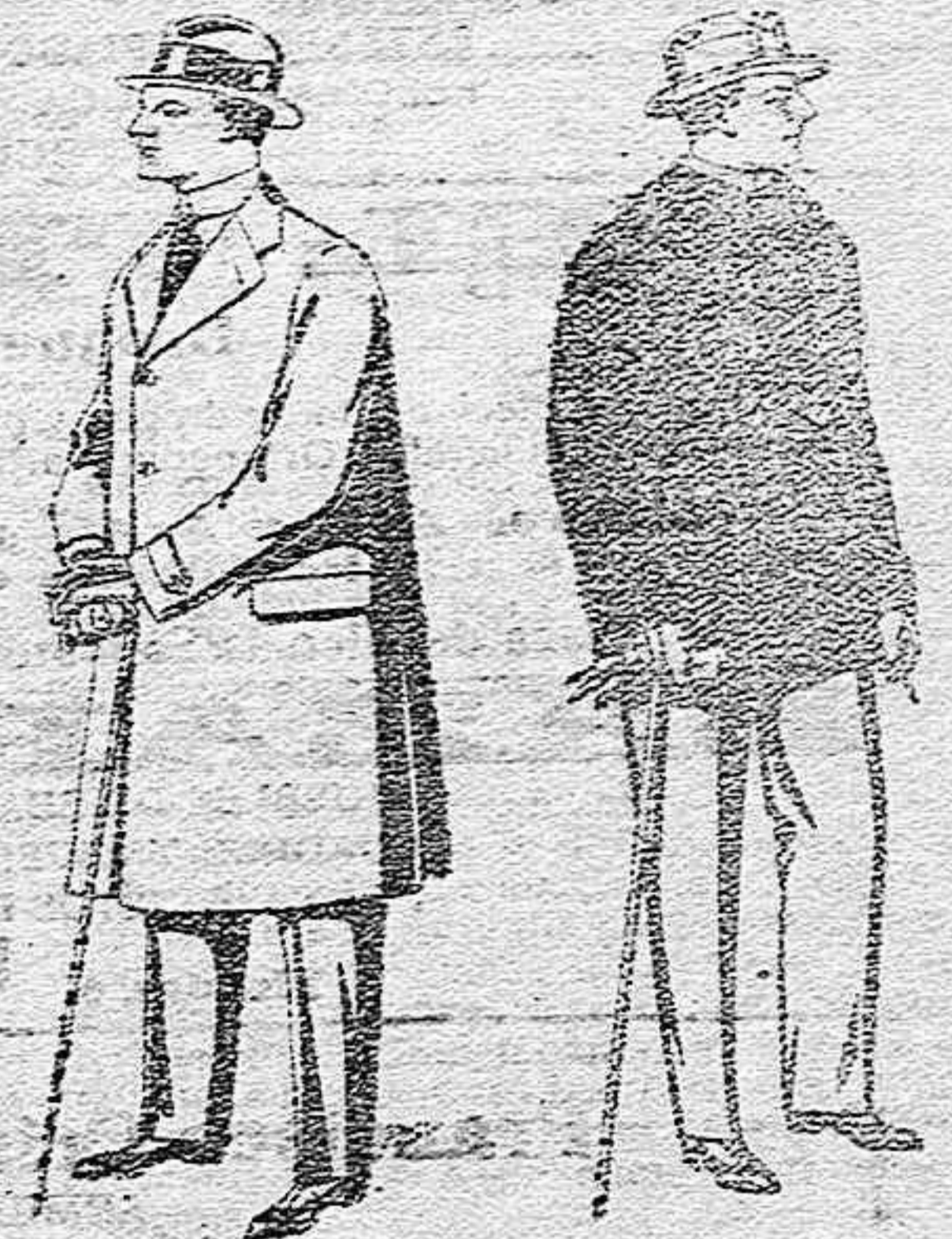
Gabanes de tejidos pluma o ratina, de pesetas 33 a 100.