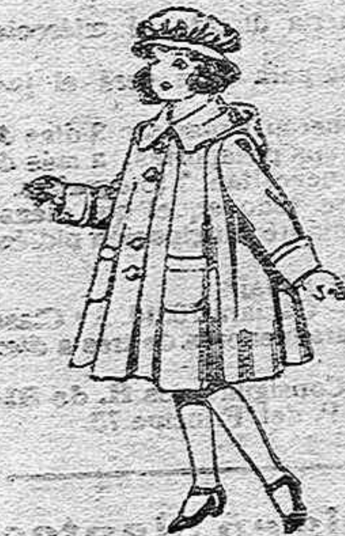
Abrigos de paten, para niñas de 4 a 9 años, de pesetas 22 a 33.