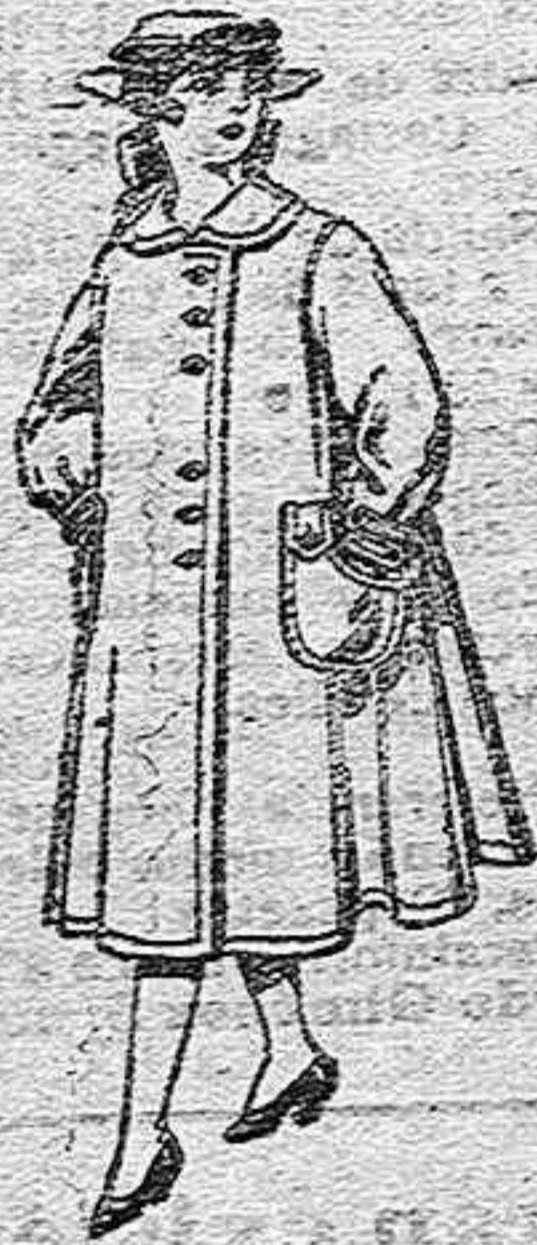
Abrigos de lana para jovencitas de 11 a 15 años, de ptas. 35 a 40

Géneros del país y extranjero para la sección a medida