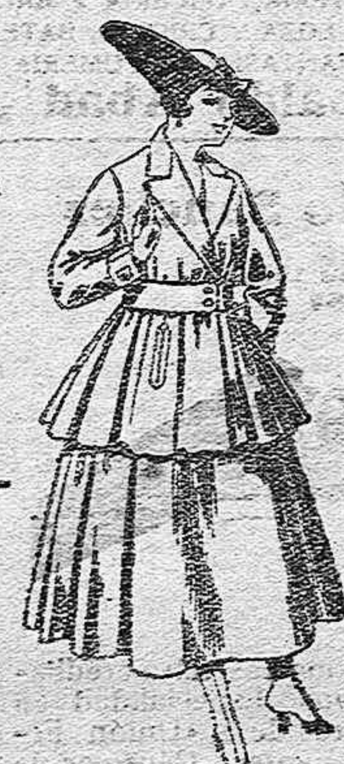
Traje de lana, en negro, azul y color, para señora, de pesetas 90 a 100.

Peletería, Camisería, Géneros de punto, Corbatería, Guantería, Sombrerería, Zapatería, Paraguas, Bastones y Artículos de Viaje.