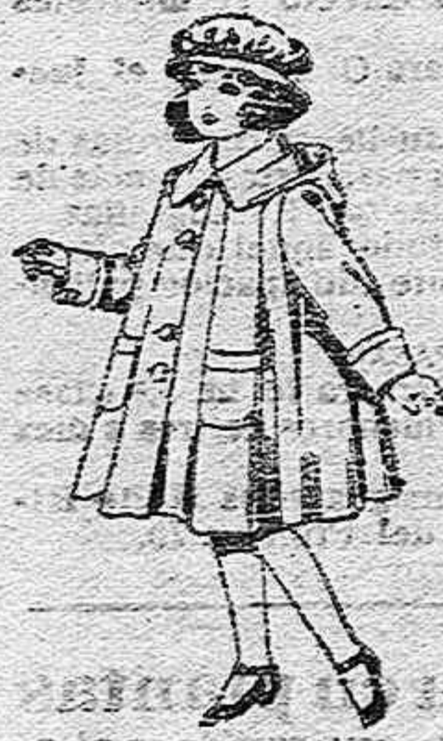
Abrigos de pater, para niñas de 4 a 9 años, de pesetas 22 a 33.