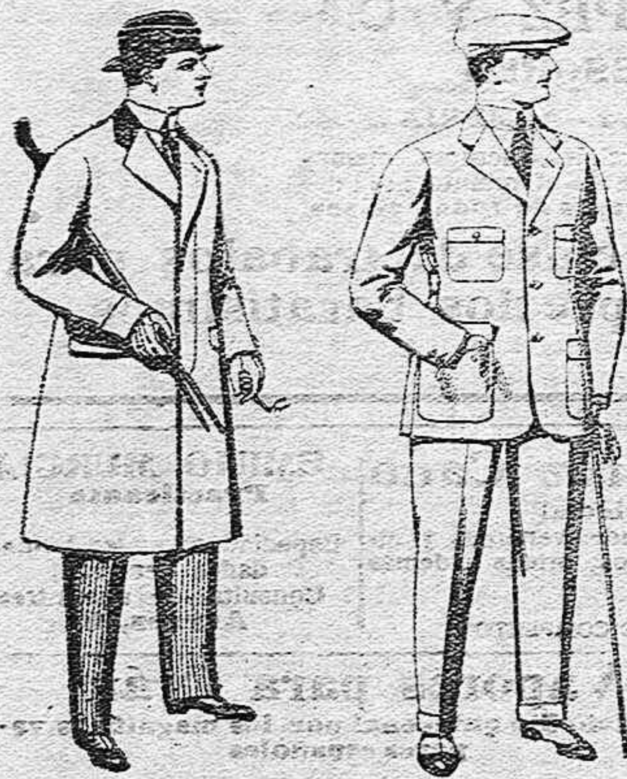
Gabanes de pater, melton y cheviot, con forros seda, saten o escocés, de pesetas 33 a 100.