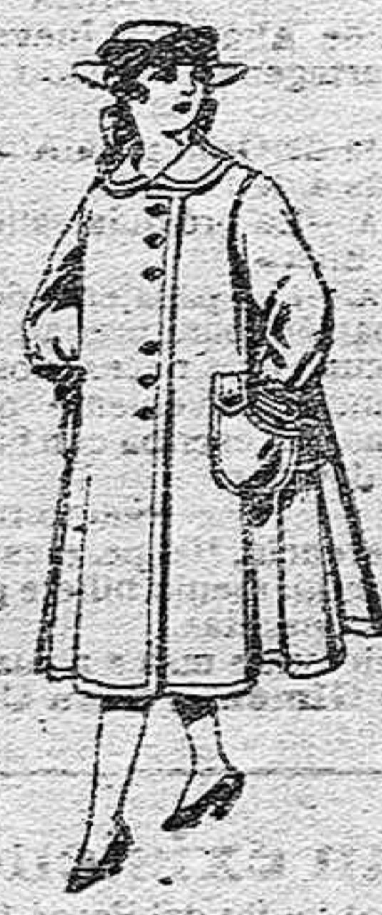
Abrigos de lana para jovencitas de 11 a 15 años, de ptas. 35 a 40.

Géneros del país y extranjero para la sección a medida