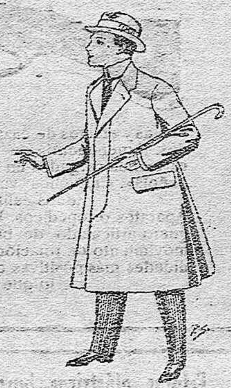
Gabanes de lana, vigonia o melton, con forros saten o seda, para niños de 10 a 12 años, de pesetas 20 a 53.