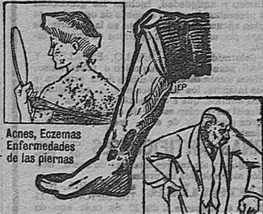
Aloes, Eczemas, Enfermedades de las piernas

Se encuentra vacante el cargo de Secretario municipal suplente del Juzgado municipal de Hércal Overa, siendo retribuido el cargo con los derechos de arancel.