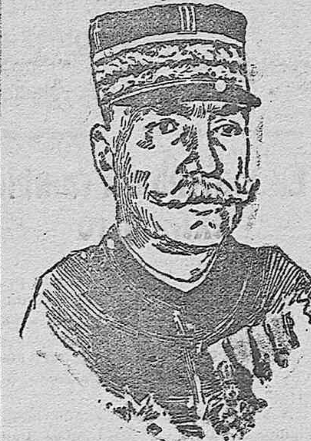
El mariscal francés M. Joffre, que llegó anoche a Madrid donde se celebrarán agasajos y fiestas en su honor.