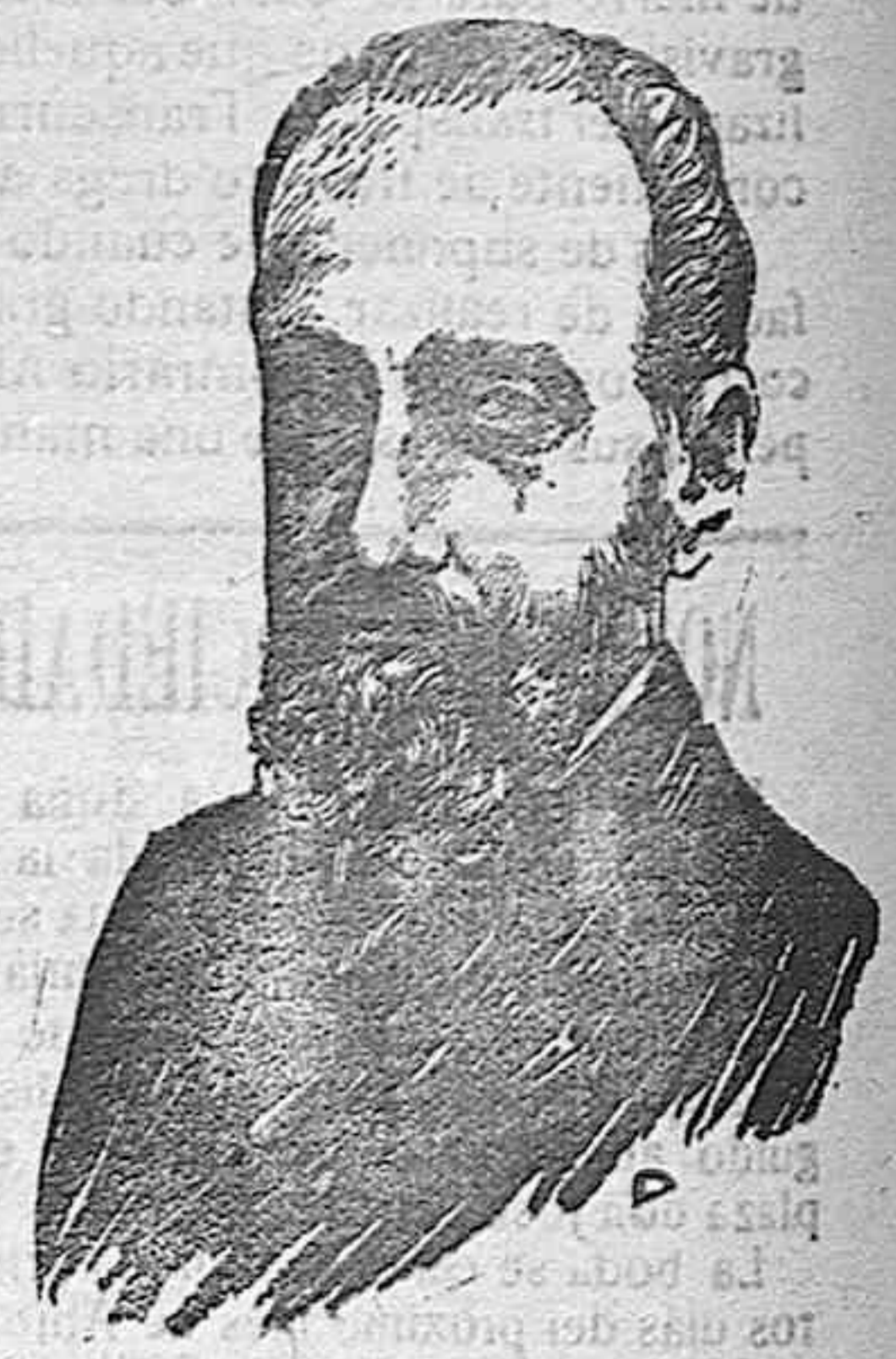
Anunciada en DIARIO DE ALMERIA