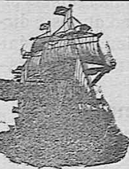
El nuevo y rápido trasatlántico