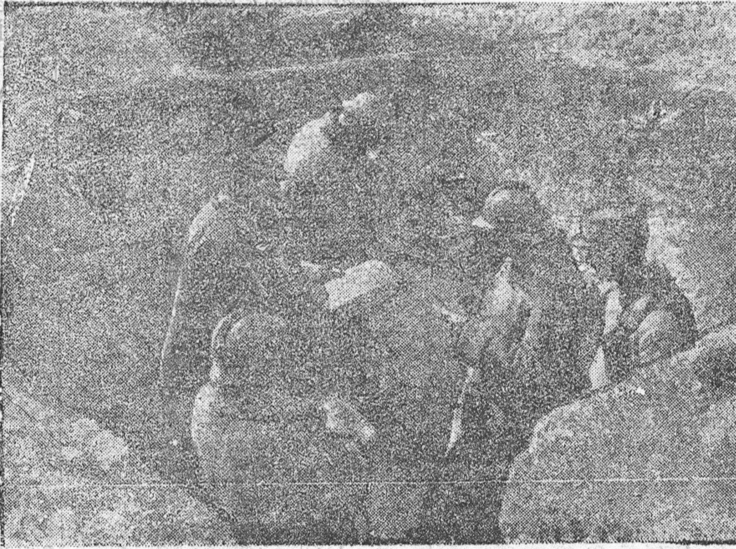
OFICIALES FRANCESES DE ARTILLERÍA EN UN OBSERVATORIO