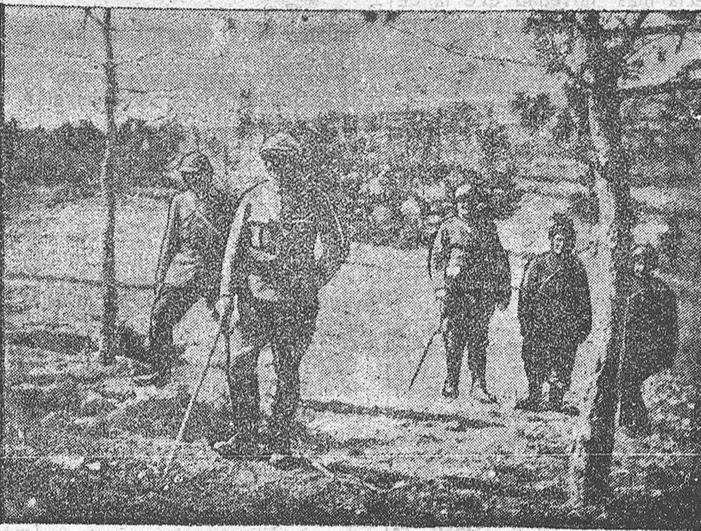
EL CORONEL DE UN REGIMIENTO DE ZUAVOS QUE SE PORTÓ HERÓICAMENTE EN EL ASALTO DE CRAONNE

Felicitémosle efusivamente, y le deseamos buenos negocios a nuestro amigo.