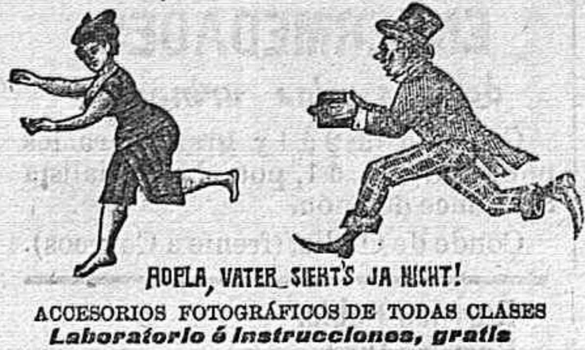
ROFLA, WATER, SIERTS JA NIGT! ACCESORIOS FOTOGRAFICOS DE TODAS CLASES Laboratorio é instrucciones, gratis

PINTURAS DE ESMALTE Inmenso surtido en hermosos colores, envasados en elegantes cajitas de todos precios Productos mata moscas, chinches, etc. AGUAS DE PATERNA, Y OTRAS, también medicinales